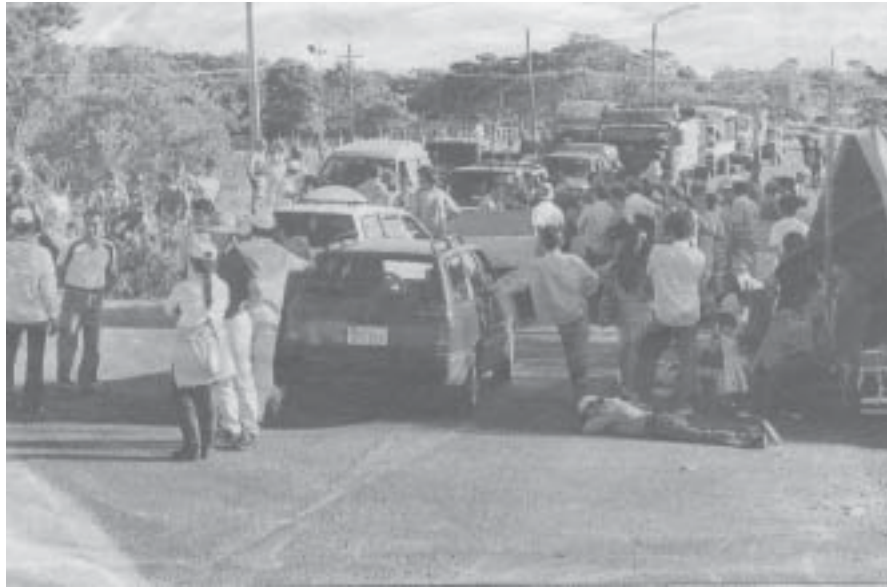
La CAP podría nuevamente movilizar maquinarias para organizar un nuevo tractorazo en protesta por el impuesto al agro.