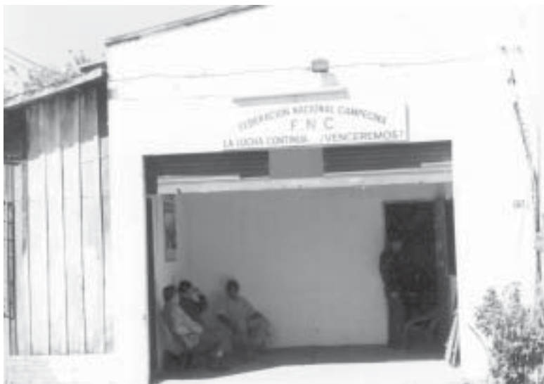
La FNC manifestó su total rechazo al proyecto de ajuste fiscal del gobierno, más conocido como impuestazo.

Los labriegos de la FNC amenazaron con ocupar las oficinas departamentales del CAH, debido a que el gobierno no cumplió con la entrega de los kits de insecticidas que había prometido. Los campesinos sostienen que ya han pasado 22 días del plazo fijado para la entrega de los insumos para los cuidados culturales de los cultivos de algodón, lo cual pone en riesgo la calidad de la cosecha. LN 22.11.03 p8/ABC 24.11.03 p20