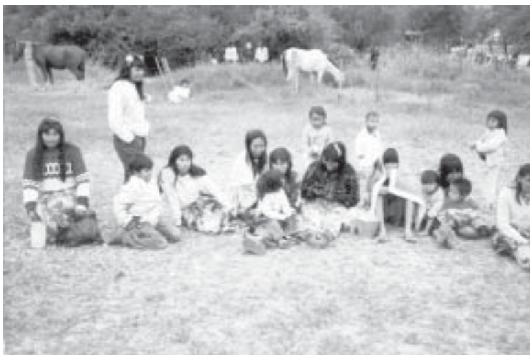
Los indígenas mbya de los departamentos de San Pedro y Caaguazú anunciaron que vendrán a Asunción para exigir la compra de tierra.

adueñando de grandes territorios en la región. Agregó que hay una incontenible lucha por la tierra en Alto Paraná, todo el mundo quiere cultivar soja, entonces se fraguan varios títulos sobre una misma tierra y los nativos siempre pierden en estos litigios. Canindeyú tampoco escapa a la fiebre de la soja. “El INDI hará relevamiento de datos y utilizará todos sus medios para precautelar los territorios nativos porque la Constitución, en su capítulo V, dice claramente que las tierras de los aborígenes no pueden ser vendidas ni arrendadas a terceros”, indicó. Otro caso que preocupa al INDI es la comunidad de Ñuapy (Amambay), donde los nativos se pelean por la comercialización de rollos. Centurión prometió visitar esta localidad para tratar de imponer orden entre sus miembros porque hay peleas entre ellos mismos. El acoso y la invasión a las comunidades indígenas es muy perjudicial para los aborígenes