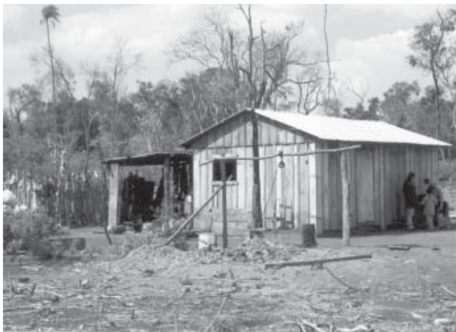
Labriegos de la Colonia Santa Clara, de Amambay denunciaron a funcionarios del IBR por mal manejo de documentaciones de mensura.

Campeños de Ara Pyahu, Cañón Colorado, 1° de Marzo y 3 de Noviembre del distrito de Capiibary (San Pedro) recibieron semillas para cultivos destinados al consumo de sus familias. Además, recibieron herramientas e insecticidas, en el marco del programa de asistencia del Bansocial, dependiente del Instituto de Bienestar Rural (IBR). El plan de referencia se denomina “Jopói Mbareterã”, que busca el arraigo de familias de labriegos que están por debajo de la línea de pobreza en el departamento de San Pedro. Explicó que la manera más efectiva de valorar este plan es trabajando en forma organizada, con apoyo de asistencia técnica y sin colores, con el fin de que todos los paraguayos víctimas de esa situación económica puedan ser asistidos y se consiga su arraigo en los asentamientos. Con fondos propios, el IBR desarrolla el proyecto Bansocial en 46 de sus asentamientos y colonias. En esta ocasión hubo 300 familias beneficiadas, las que en una primera etapa recibieron semillas de algodón y por las que tendrán que abonar solo 6,86 centavos del dólar, luego vender su producción. El presidente del IBR, Hermenegildo Alonso, detalló que entre semillas de renta y consumo, los beneficiarios del plan recibieron: sésamo; 300 bolsas de semillas para autoconsumo, con 8 variedades; cuatro variedades de maíz, arroz secano, zapallo, poroto, etc. ABC 17.11.03 p19