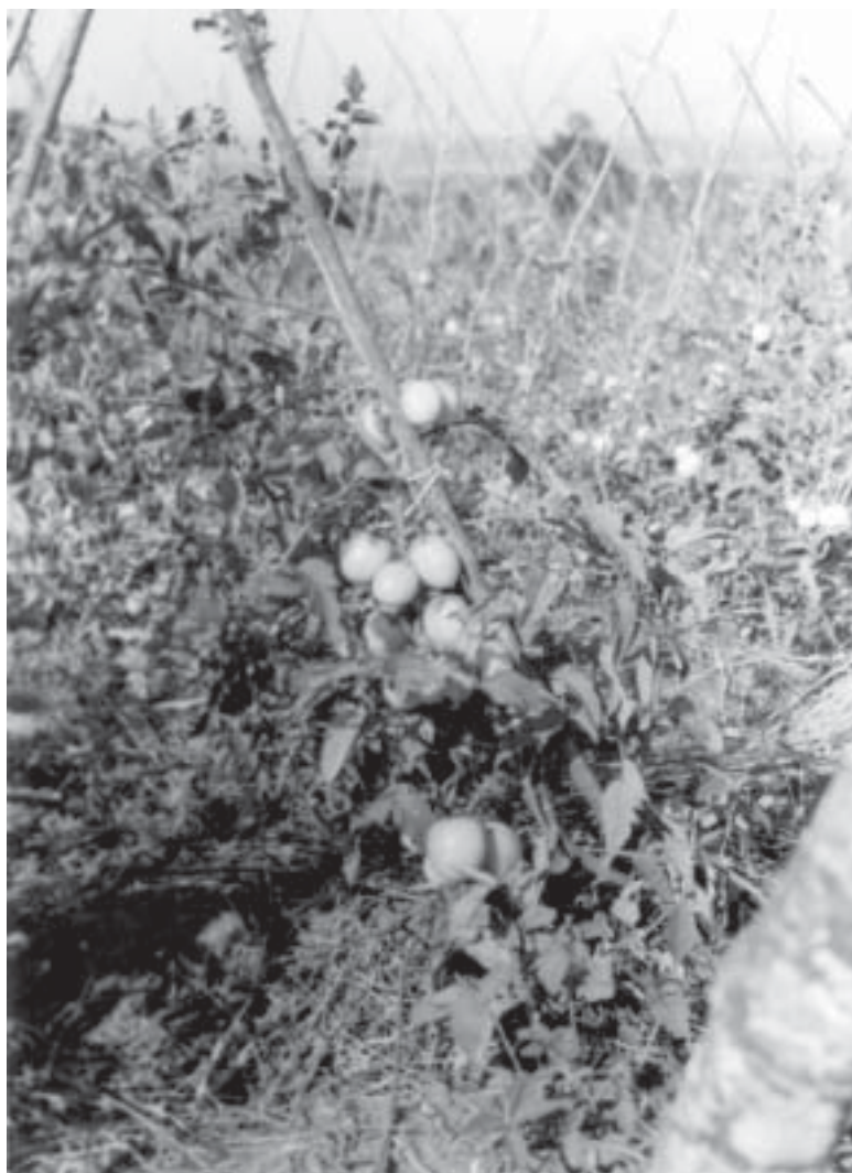
El contrabando de productos frutihortícolas desde la Argentina y el Brasil está creando serias dificultades a la comercialización de productos nacionales.

El contrabando de productos frutihortícolas desde la Argentina y el Brasil está creando serias dificultades a la comercialización de productos nacionales en los diferentes mercados de Paraguari. Más de 150.000 kilos de tomates cultivados en la compañía Ñuatí (Paraguari) y gran cantidad de pimientos, sandía y melones corren riesgos de pudrirse en el campo por falta de mercado. La denuncia fue formulada por productores organizados de la compañía Ñuatí, quienes poseen una buena partida de tomates, pimientos, sandía y melón de diferentes variedades sin colocación alguna. Las producciones citadas se caracterizan por su excelente calidad, bajo precio y la casi nula utilización de productos químicos en su tratamiento. Ante la falta de colocación a nivel local, la esperanza de los labriegos se centra ahora en potenciales acopiadores del Mercado de Abasto de la capital y compradores de otras zonas. Sin embargo, la ilusión se diluye con el ingreso masivo de productos frutihortícolas, principalmente tomate, de Argentina y Brasil. El mismo no solo redujo la venta de la citada hortaliza, sino que a nivel de finca bajó el precio al 50%. Los horticultores