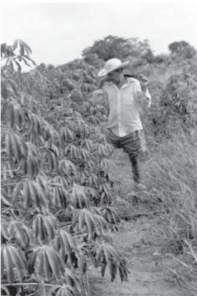
La agroindustria Almidones SA (Almisa) con asiento en Caaguazú y Coronel Bogado, está quedando sin materia prima para la producción de almidón por la escasez de mandioca.

casez de la mandioca se da en coincidencia con el boom de la soja, que para la zafra 2003/04 tiene alta cotización en el mercado internacional, desplazando al cultivo de la mandioca. De acuerdo a los informes, los grandes productores de la oleaginosa, en su mayoría brasiguayos del estado Paraná-Brasil, y descen-