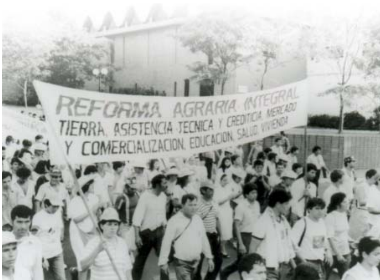
Los campesinos/as de la MCNOC realizaron su protesta anual. (foto archivo de años anteriores)

Con reclamos como la reglamentación del uso de agroquímicos, una nueva Banca Pública, y la recuperación de las tierras malhabidas, la MCNOC inició su marcha anual el 16 de marzo pasado. La movilización se llevó a cabo en varios puntos del país y en algunos lugares se produjeron cierres de rutas. La medida de protesta fue levantada tras la firma de un acuerdo de varios puntos con el Gobierno nacional.