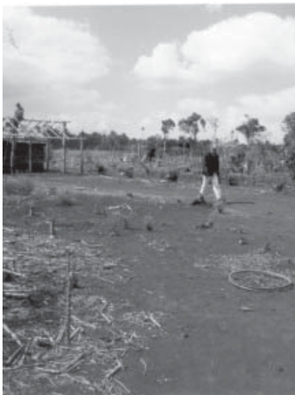
Más de 100 familias de la colonia Marangatú, de Nueva Esperanza de Canindeyú, viven en zozobra ante la posibilidad de perder sus tierras.

madamente. Dentro de las propiedades reclamadas se encuentra el casco urbano, que incluye escuelas, parroquias y varias otras instituciones públicas y comunitarias. Marangatú está ubicada a 200 km de Ciudad del Este, en el distrito de Nueva Esperanza, departamento de Canindeyú. Las demandas contra los colonos han sido radicadas por Ivon Oberti, un ciudadano francés que reside en Ciudad del Este, y la colonizadora Agrícola Paraná, también de la capital altoparanaense. ABC 22.03.04 p40