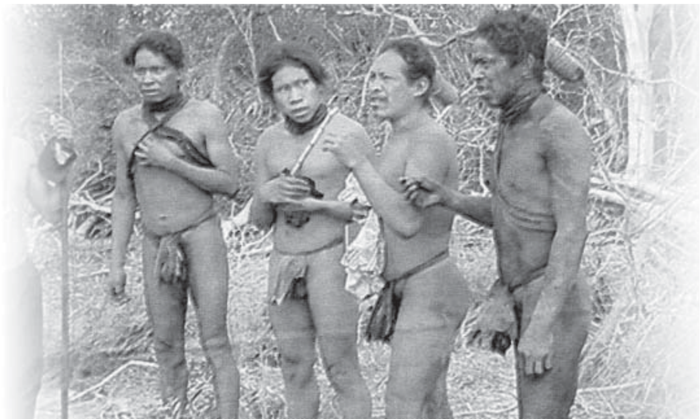
Cuatro jóvenes silvícolas hicieron contacto con los ayoreos en la zona de Filadelfia, Chaco.

Otros siete hombres, cinco mujeres y seis niños silvícolas abandonaron el monte y se encuentran en la comunidad Arocojnadi bajo estricta reserva y fuera del alcance del resto de la población. Las primeras informaciones indican que todos se encuentran en buen estado de salud, pero están aislados para protegerlos de infecciones que eventualmente pueden adquirir al tener contacto con gente y ambientes distintos a los que acostumbran. Se presume que estos nativos se vieron forzados a abandonar el monte movidos por el hambre, dado que su hábitat natural está devastado. La situación que se vive con los ayoreos silvícolas del Chaco es casi única en el mundo, y por esta razón constituyen “patrimonio de la humanidad” y la humanidad debe responsabilizarse de la integridad de ellos. UH 06.03.04 p26