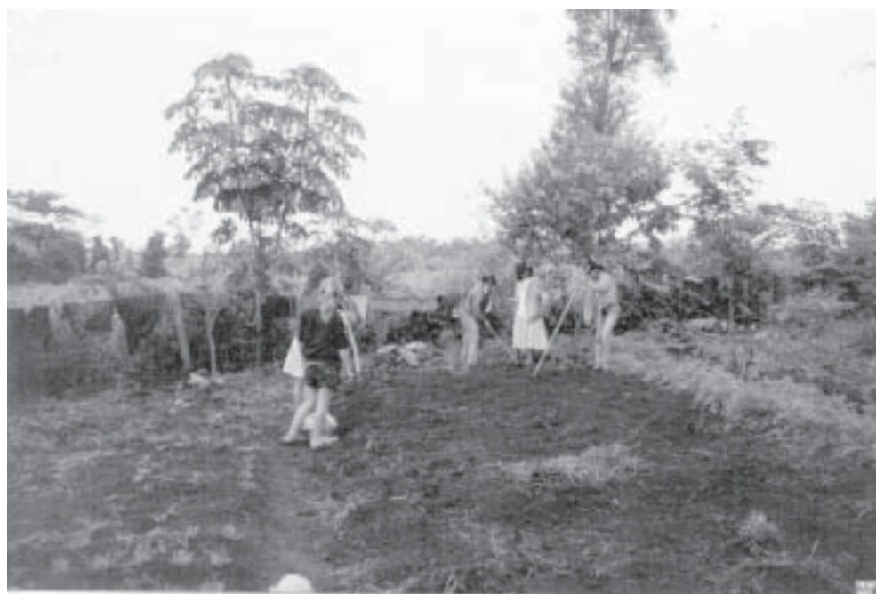
Paraguay y Brasil suscribirán un convenio de cooperación y alianza para el desarrollo de la agricultura familiar.

Con la intención de regularizar la situación de los ciudadanos brasileños que viven y tra-