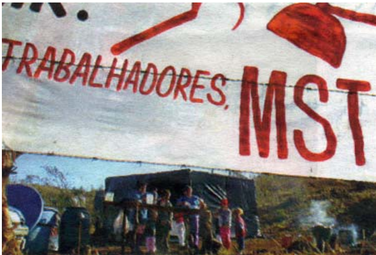
EL MST de Brasil, reinicia las protestas por la falta de reforma agraria en ese país.

Unas 300 familias, hacinadas en carpas de plástico y bambú, reinician su protesta con la ocupación de una hacienda en el estado de Río de Janeiro, en otra acción del Movimiento de los Trabajadores Sin Tierra (MST), una de las espinas en el gobierno de Luiz Inacio Lula da Silva. La hacienda, Santa Justina, en Mangaratiba, a 70 km de la ciudad de Río de Janeiro, fue tomada por el MST, que pide que la improductiva propiedad de 850 hectáreas sea dividida entre las familias. Las ocupaciones son la principal forma de presión del MST en todo el Brasil para pedir que se repartan las tierras, pero en los remotos estados del interior del país no siempre consiguen tanta publicidad. Con esta acción, el MST lanza una nueva campaña de ocupación de tierras para reclamar el cumplimiento de las promesas de reforma agraria formuladas por el presidente Lula da Silva. ABC 26.03.04 p24 / LN 29.03.04 contratapa