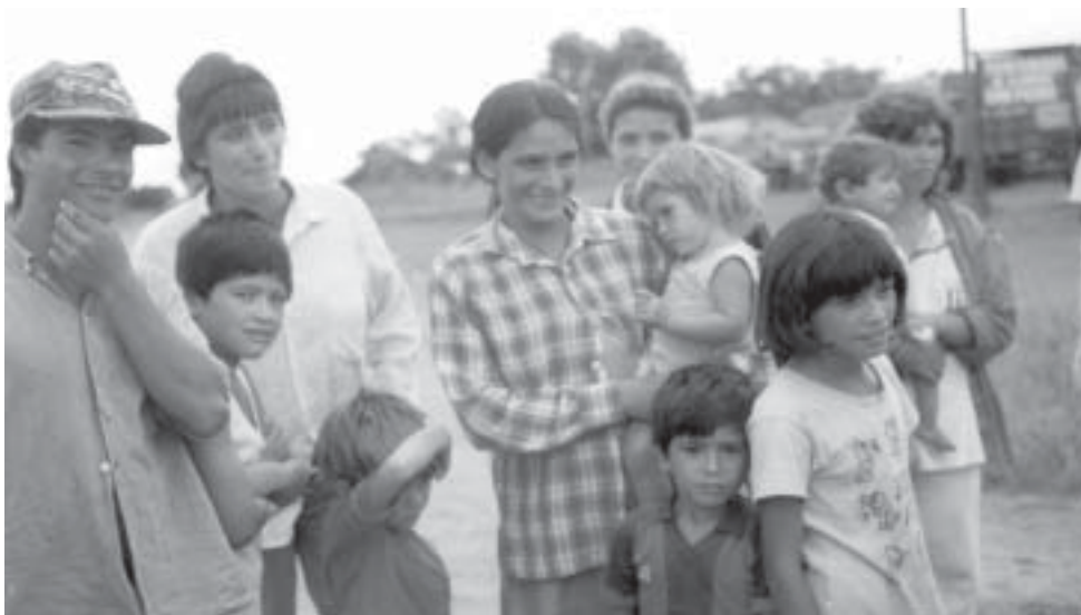
El 19 de marzo se recordó el Día del Campesino, por tal motivo el presidente Nicanor Duarte Frutos emitió un mensaje para el sector.