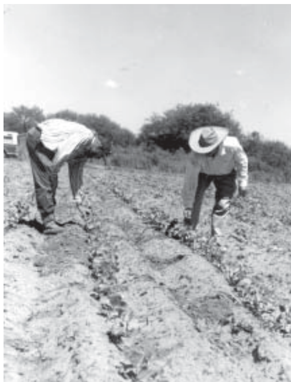
La FNC defiende un modelo de desarrollo diferente al modelo agroexportador, indicaron sus dirigentes.