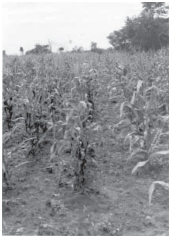
El MAG prevé una caída de la producción en varios de los 12 rubros agrícolas principales

taron dos nuevas variedades de algodón con potencial de producción, creadas y adaptadas en el país. Se trata de variedades denominadas IAN 424 e IAN 425. El acto se realizó en la colonia menonita Paratodo de Presidente Hayes, Chaco. LN 06.04.04 p6