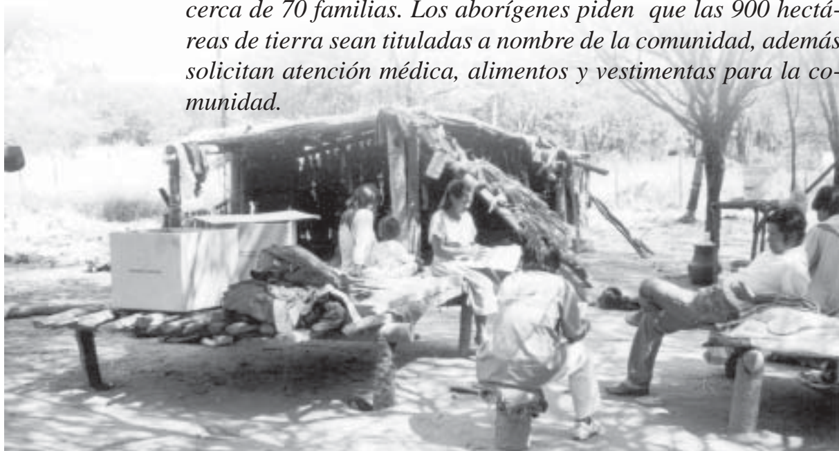
El presidente de la República, Nicanor Duarte Frutos, prometió cambiar la realidad de los pueblos indígenas.

El Gobierno nacional destinará fondos recibidos de la Unión Europea para el desarrollo de las comunidades indígenas, según informó el presidente Nicanor Duarte Frutos. La Cámara de Diputados se ratificó en su sanción original del proyecto de ley que otorga en favor de los indígenas unas 15.000 hectáreas de la estancia del Ejército, Pedernal, en el Chaco paraguayo. El proyecto vuelve a la Cámara de Senadores, que había modificado la norma partiendo en dos, una parte para los indígenas y la otra mitad en favor del IBR para destinar a los fines de la reforma agraria. Por otra parte, aproximadamente 100 nativos Mbyá Guaraní llegaron desde la lejana localidad de Joyvy, distrito de Caaguazú, donde se encuentra el asentamiento que alberga a cerca de 70 familias. Los aborígenes piden que las 900 hectáreas de tierra sean tituladas a nombre de la comunidad, además solicitan atención médica, alimentos y vestimentas para la comunidad.