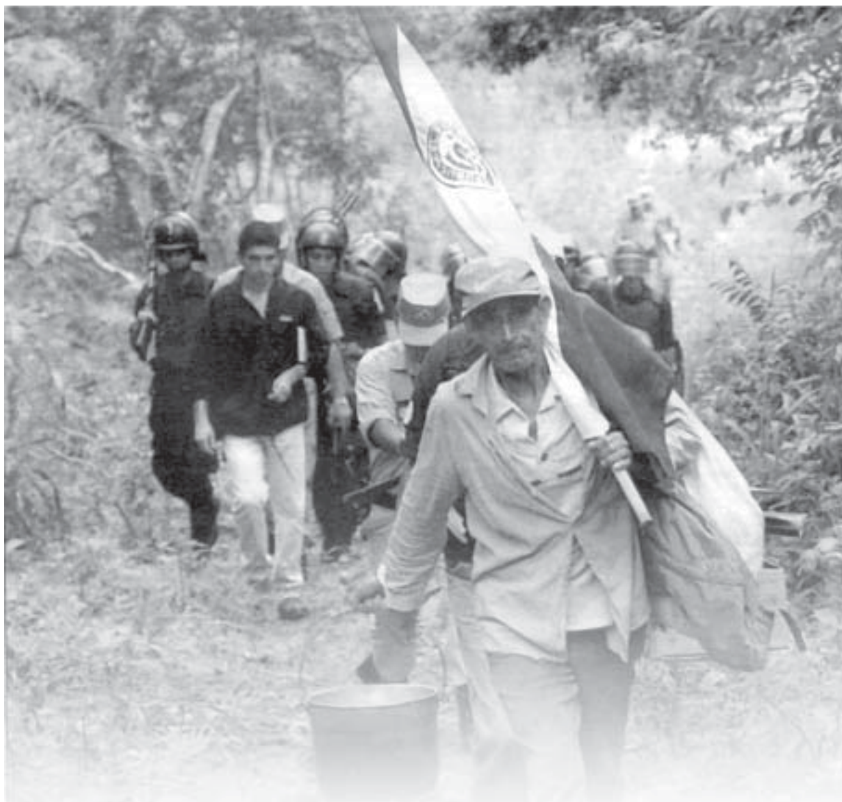
El Gobierno movió todo su aparato represor para el desalojo de campesinos.

denuncia de los campesinos. El presidente del IBR, Erico Ibáñez, anunció que recibió la autorización del presidente de la República, Nicanor Duarte Frutos, para negociar la compra de tierras ubicadas en Nueva Germania, pertenecientes a un ciudadano brasileño. Las 2.000 hectáreas de propiedad que están en el departamento de San Pedro ya fueron negociadas en julio de 2003 para 110 familias, y el propietario anterior lo vendió a un brasileño de apellido Fischer. Ahora, si el nuevo dueño no quiere negociar, el IBR buscará la expro-