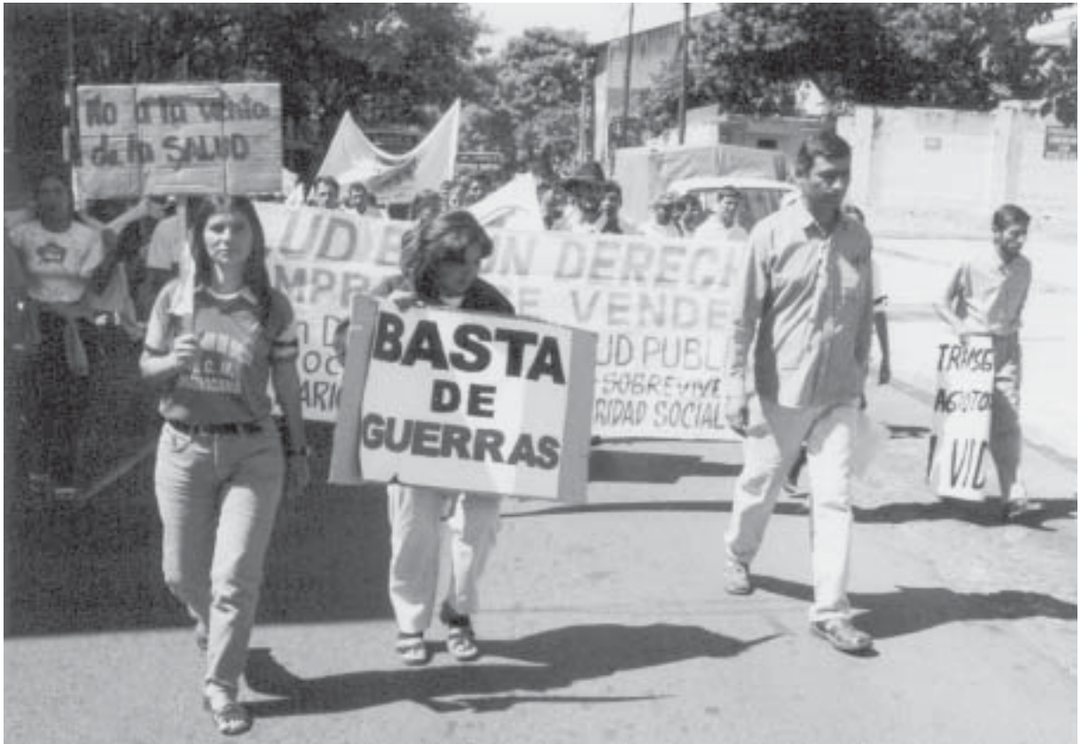
Las organizaciones sociales repudian la contaminación ambiental causada por los agrotóxicos.