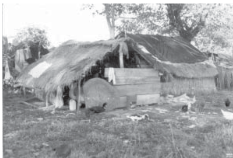
Las primeras familias en instalarse en el asentamiento, lo hicieron en forma muy precaria.