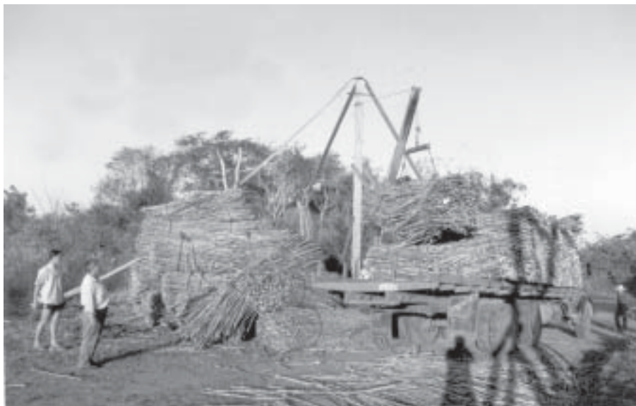
Uno de los sectores afectados por la sequía es el de la caña de azúcar, que registra poco desarrollo en la zona de Guairá.

cultivos que han sido afectados son el algodón y los granos en general, y los daños son considerables según un informe remitido por la Dirección de Extensión Agraria. UH 08.04.04 p16 / ABC 12.04.04 p30