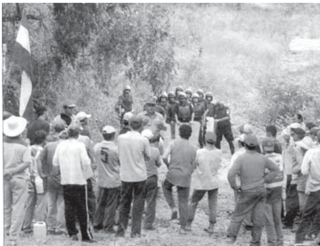
Varias propiedades del departamento de San Pedro fueron ocupadas en el mes de abril.