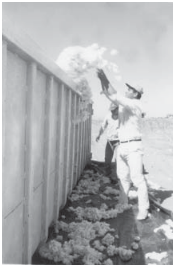
Las perspectivas para el precio del algodón, para la próxima campaña, son poco alentadoras