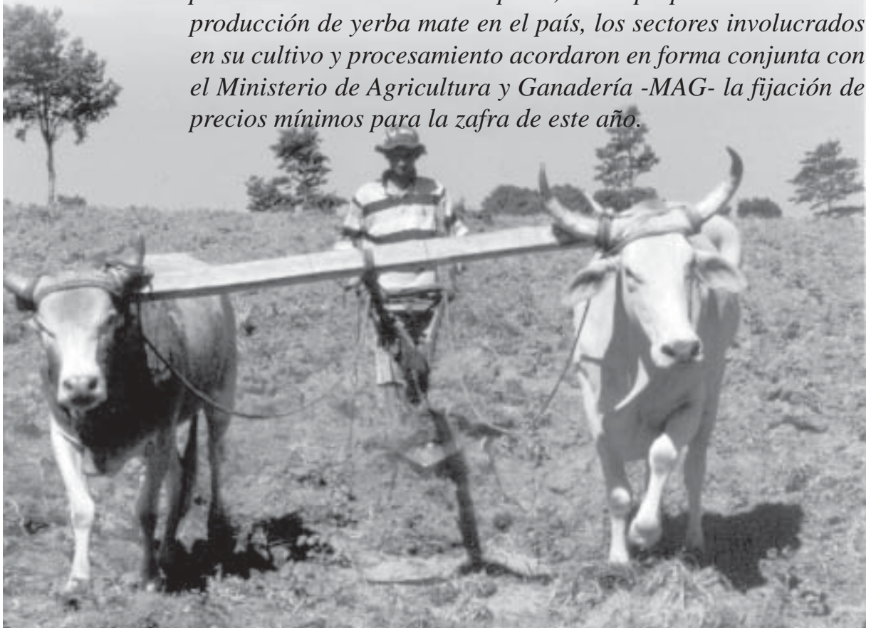
El Gobierno está intentando crear un padrón de campesinos a quienes otorgaron tierras.

El Gobierno está intentando crear un padrón de campesinos a quienes otorgaron tierras. De esa manera el IBR verificará a quienes entregaron tierras y las abandonaron, y quiénes no tienen terreno, informó Nicanor Duarte Frutos, durante la audición radial “Habla el Presidente”, difundida a través de Radio Nacional del Paraguay. En momentos de tensión, a raíz de la amenaza campesina de ocupar propiedades, el presidente Nicanor Duarte Frutos hizo un llamado a un pacto social a los terratenientes cuyas propiedades no están explotadas racionalmente, para crear un mercado de la tierra. Reclamó también a los campesinos diálogo para llegar a una solución pacífica a la problemática rural. Por otra parte, con el propósito de salvar la producción de yerba mate en el país, los sectores involucrados en su cultivo y procesamiento acordaron en forma conjunta con el Ministerio de Agricultura y Ganadería -MAG- la fijación de precios mínimos para la zafra de este año.