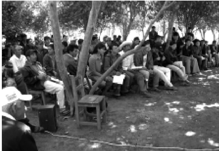
Asentamiento Calixto Cabral

Participaron de este encuentro, 26 personas, de las cuales 4 eran mujeres y 22 eran varones, quienes luego debatieron en plenaria cómo se relacionan los intereses políticos con los intereses económicos, pero sobre todo en el nivel internacional.