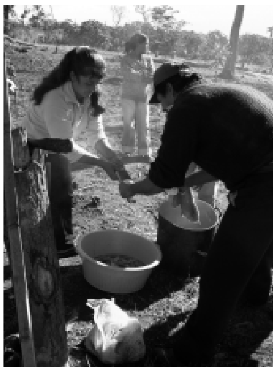
Asentamiento Unión Agrícola. Distrito 3 de Mayo, Caazapá

desarrollado en dos momentos, en un primer momento se realizó un análisis de coyuntura en el que se definieron conceptos claves como Estado, Gobierno, desarrollo, Reforma Agraria Integral y cuáles son los actores principales en el escenario rural. Los/as participantes señalaron que es necesario partir de una Reforma Agraria Integral para que el sector y el país pueda desarrollarse. Manifestaron además