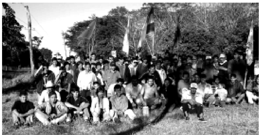
Participantes del Taller. Asentamiento Calixto Cabral

La jornada se desarrolló en dos momentos, el de análisis de coyuntura y el de diagnóstico. En el análisis de coyuntura se debatieron temas como el rol del Estado y el Gobierno. Así también, el papel que juegan los diferentes actores dentro de la sociedad. Uno de los temas que generó más discusión fue la tenencia de la tierra en nuestro país. En ese sentido, los/as participantes conceptualizaron a la tierra como fuente de vida, trabajo, producción, progreso. Los campesinos señalaron que al obtener la tierra se puede tener acceso a educación, salud, al autoconsumo y a la comercialización de la producción agrícola. Se analizó también la importancia de entender quiénes somos, qué queremos y cuáles son nuestros objetivos. Se trabajaron los temas de identidad y cultura.