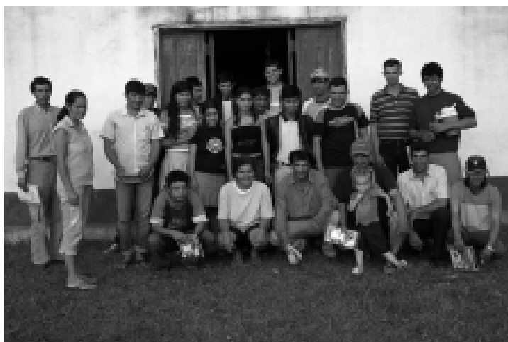
Participantes del Taller.

El 22 de mayo, se realizó un encuentro en el Asentamiento Unión Agrícola, del distrito 3 de Mayo de Caazapá. Los integrantes de la Organización de Lucha por la Tierra, del asentamiento, estaban celebrando el primer aniversario de la conquista de estas tierras, tras