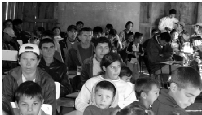
Unión Agrícola. Participantes del taller

ocho años de lucha. En el lugar están asentadas aproximadamente 150 familias, todas de la OLT, y ya tienen sus primeras cosechas para la seguridad alimentaria. El ambiente del encuentro fue muy ameno, pues la comunidad estaba congregada en torno a los festejos, la organización de los alimentos y la llegada de las capacitadoras del CDE. Los niños y niñas del asentamiento también tuvieron activa participación en las actividades recreativas.