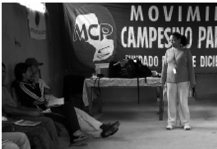
Jóvenes del MCP

En primer lugar, se definieron algunos conceptos claves para iniciar un trabajo de planificación. Así también, los/as jóvenes definieron al MCP y cuáles son sus objetivos como organización. Se realizaron trabajos grupales para hacer el diagnóstico de la situación actual de los/as jóvenes de San Isidro y cuáles son las expectativas que tienen en cuanto a la organización.