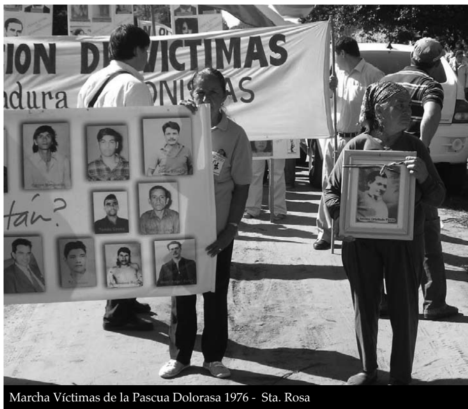
Marcha Víctimas de la Pascua Dolorosa 1976 - Sta. Rosa

21/05/2002: Paro Nacional contra las privatizaciones Campesinos reunidos en el Congreso Democrático del Pueblo (CDP), compuesto por los dos más importantes bloques de organizaciones populares surgidas luego de la crisis y casi desaparición de las centrales sindicales destruidas por la corrupción y el burocratismo: la Plenaria Popular Contra el Terrorismo de Estado y el Frente por la Defensa del Patrimonio Nacional, que comenzó su lucha contra la reforma de la banca pública. Estas dos organizacio-