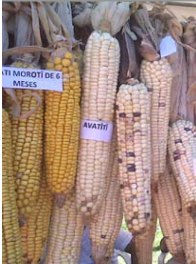
HEÑÓI JEY PARAGUAY