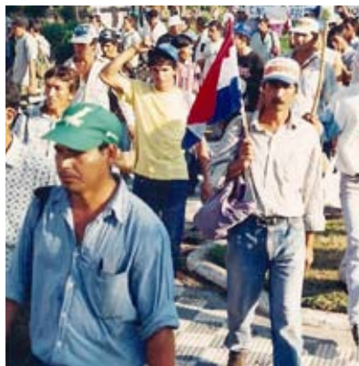
EXIGEN JUSTICIA POR ASESINATOS DE CAMPESINOS