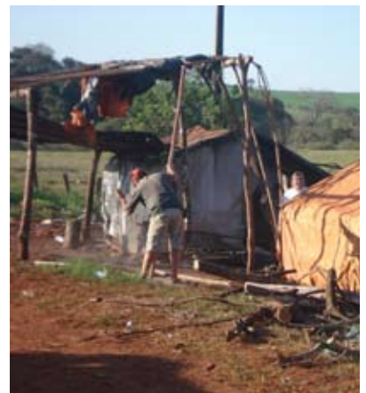
INTENSOS RECLAMOS DE TIERRA