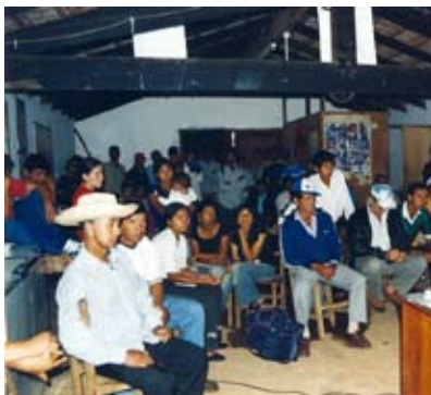
ORGANIZACIONES CAMPESINAS REACCIONAN ANTE CAMBIOS EN EL INDERT