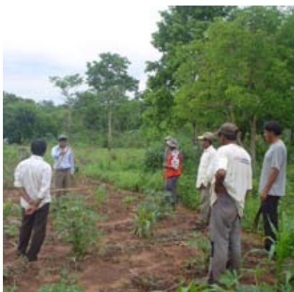
SITUACIÓN DE LA RAI EN PARAGUAY