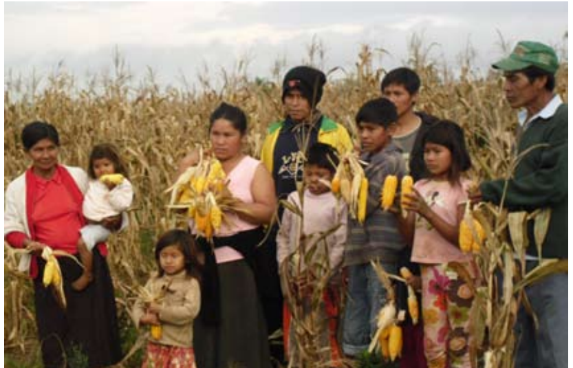
MUJERES CAMPESINAS E INDÍGENAS PROTEGEN SEMILLAS NATIVAS Y CRIOLLAS