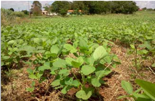
RECRUDECE INVASIÓN SOJERA