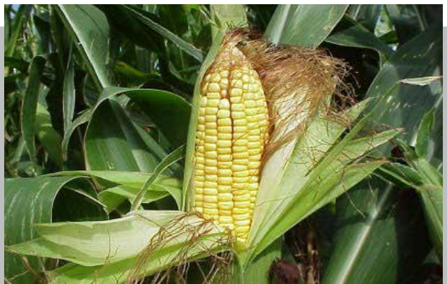
FRANCO INSISTE EN QUE TRANSGÉNICOS NO AFECTA LA SALUD