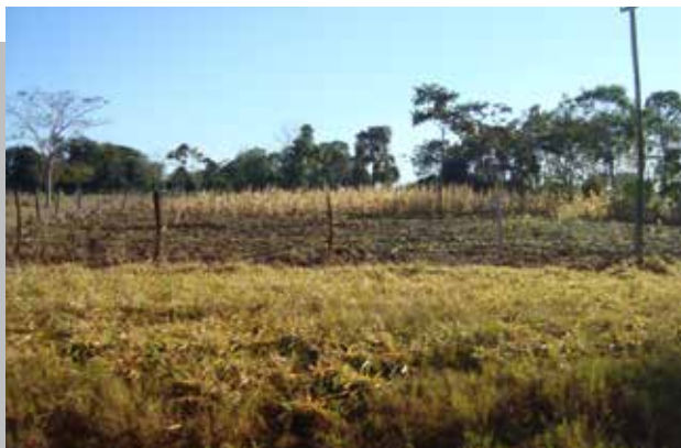
TIERRAS DE FAVERO NO SERAN EXPROPIADAS