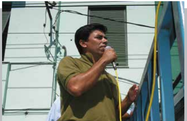
FNC ORGANIZA DEBATES EN TORNO A SEMILLAS TRANSGÉNICAS