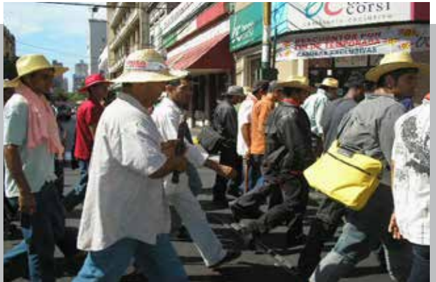
MARCHAN POR LIBERACIÓN DE CAMPESINOS DETENIDOS