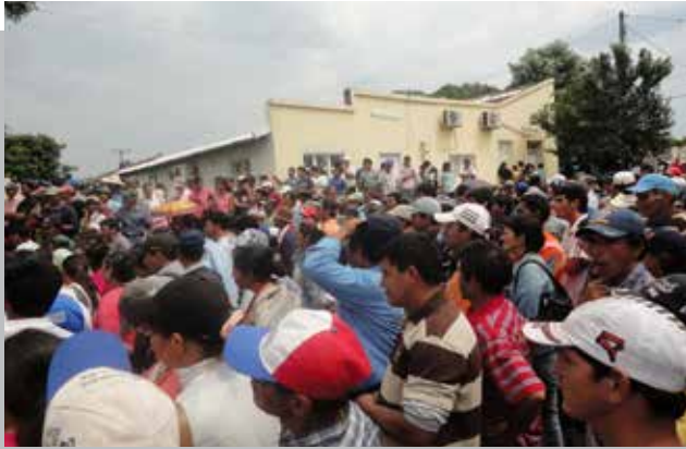
2012 AÑO DE GRANDES CONTRASTES