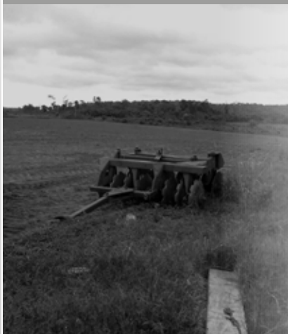
Cordinadora de Mujeres Campesinas (CMC)

Las organizaciones campesinas nacionales sentaron postura ante la aprobación de la Ley Alianza Público-Privada, a las que denominan más bien ley de privatización. En ese sentido, la dirigencia campesina considera que la mencionada disposición legal no beneficiará al sector. Igualmente consideran que esta política del gobierno de Cartes pone en riesgo el patrimonio y la soberanía del país.