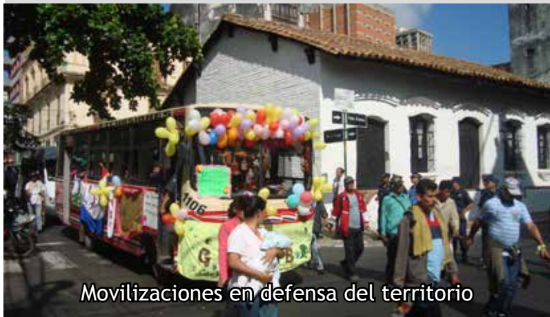
Movilizaciónes en defensa del territorio