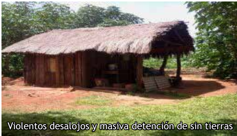
Violentos desalojos y masiva detención de sin tierras