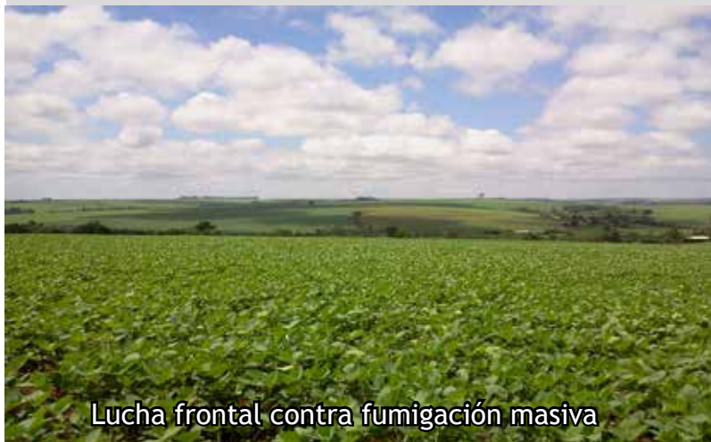
Lucha frontal contra fumigación masiva

La edición de esta revista se realiza gracias a: