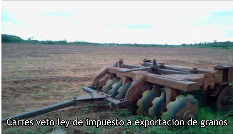
Cartes veto ley de impuesto a exportación de granos