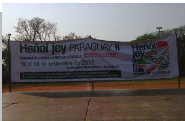
ORGANIZACIONES CAMPESINAS RECHAZAN SEMILLAS TRANSGÉNICAS