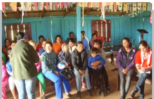
PLANIFICACIÓN COMUNITARIA CON OBSTÁCULOS Y DESAFÍOS