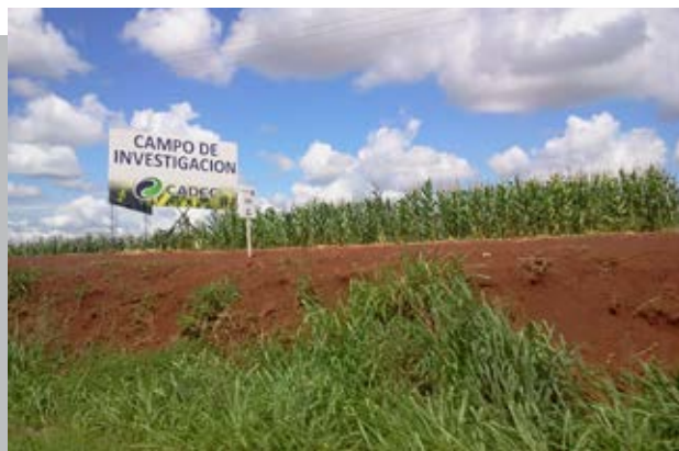
FRANCO DECRETA USO DE SEMILLAS TRANSGÉNICAS