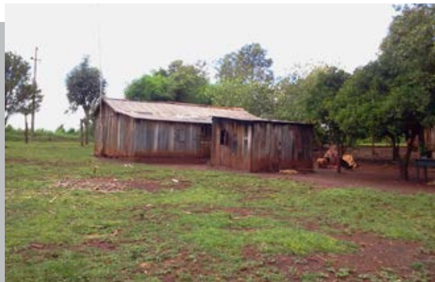
EJECUTIVO SANCIONARÁ VENTA DE DERECHERAS