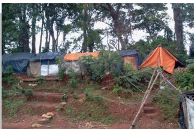
SE REANUDA CONFLICTO EN ÑACUNDAY