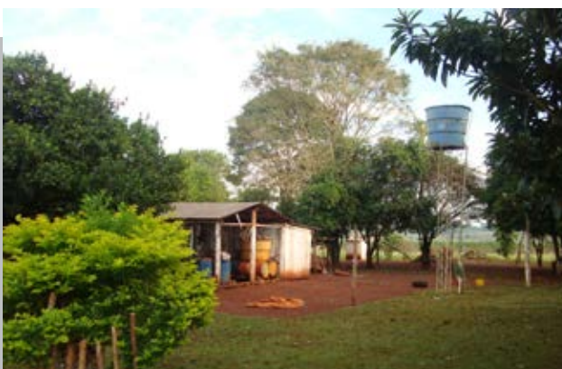
INDERT EXPERIMENTA FUERTES CAMBIOS ANTE NUEVA ADMINISTRACIÓN