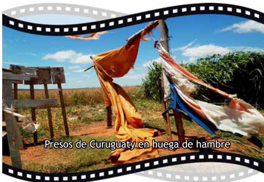
Presos de Curuguaty en huelga de hambre

El contenido es de responsabilidad exclusiva de los/as autores/as y no compromete a la institución que colabora en su elaboración y publicación.