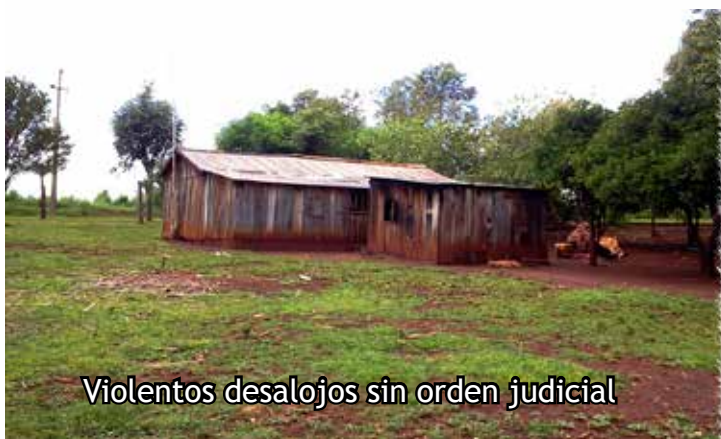
Violentos desalojos sin orden judicial