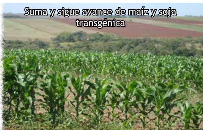
Suma y sigue avance de maíz y soja transgénica

La edición de esta revista se realiza gracias a: