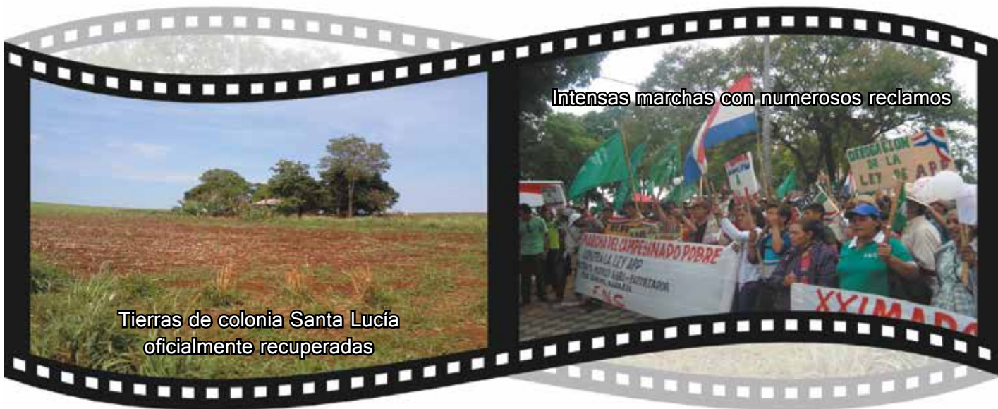
Tierras de colonia Santa Lucía oficialmente recuperadas