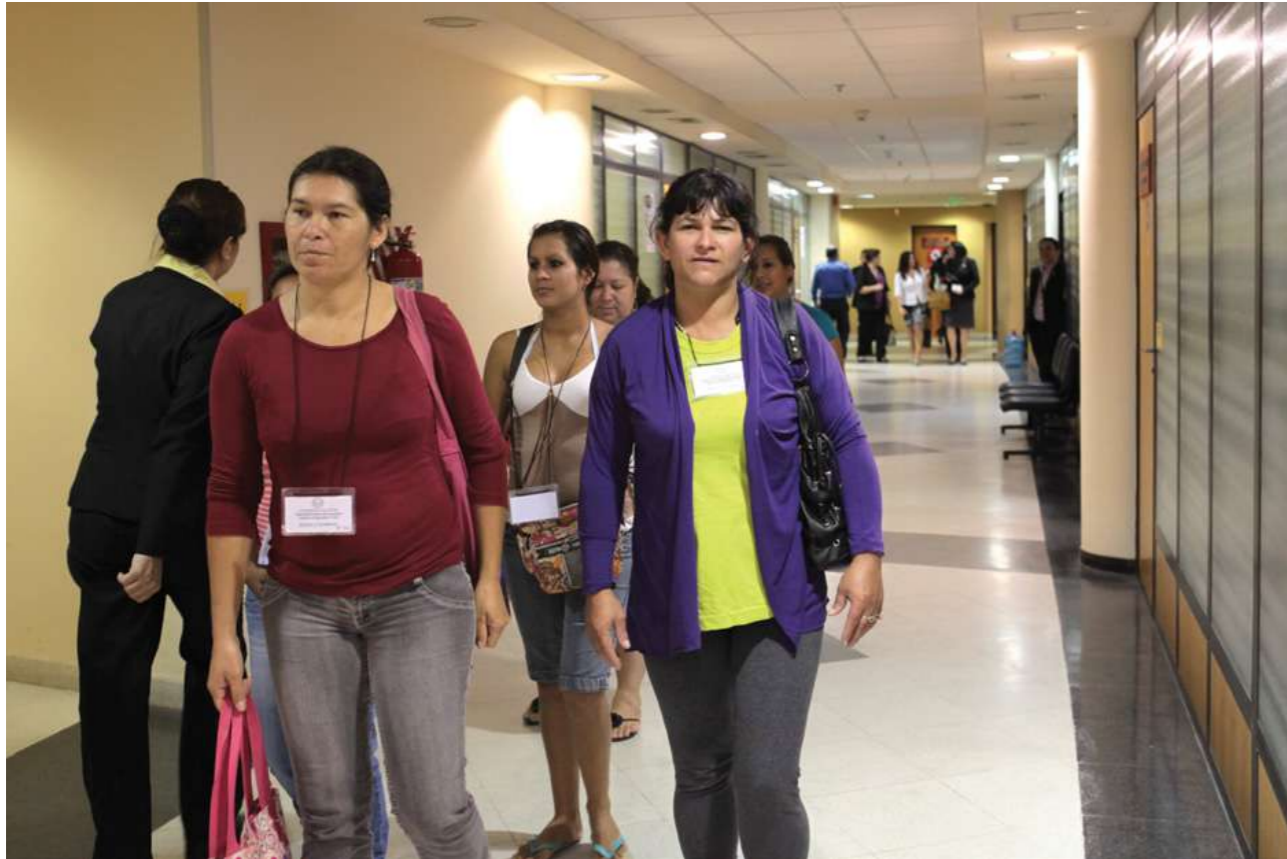
6 de mayo de 2014. Recorriendo pasillos para lobby en el Congreso.