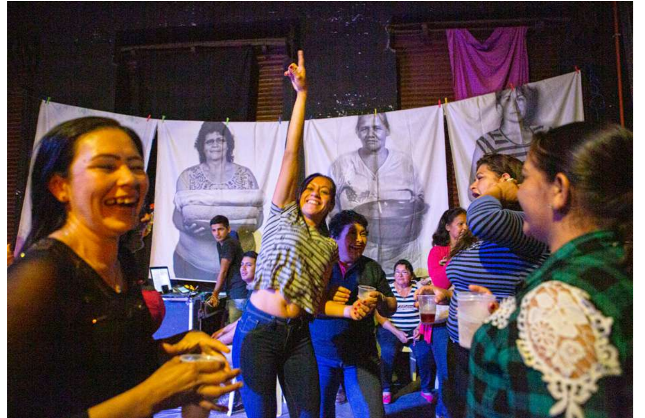
24 y 25 de agosto de 2019. Final del Encuentro Nacional de Trabajadoras Domésticas. La Caósfera. Asunción.