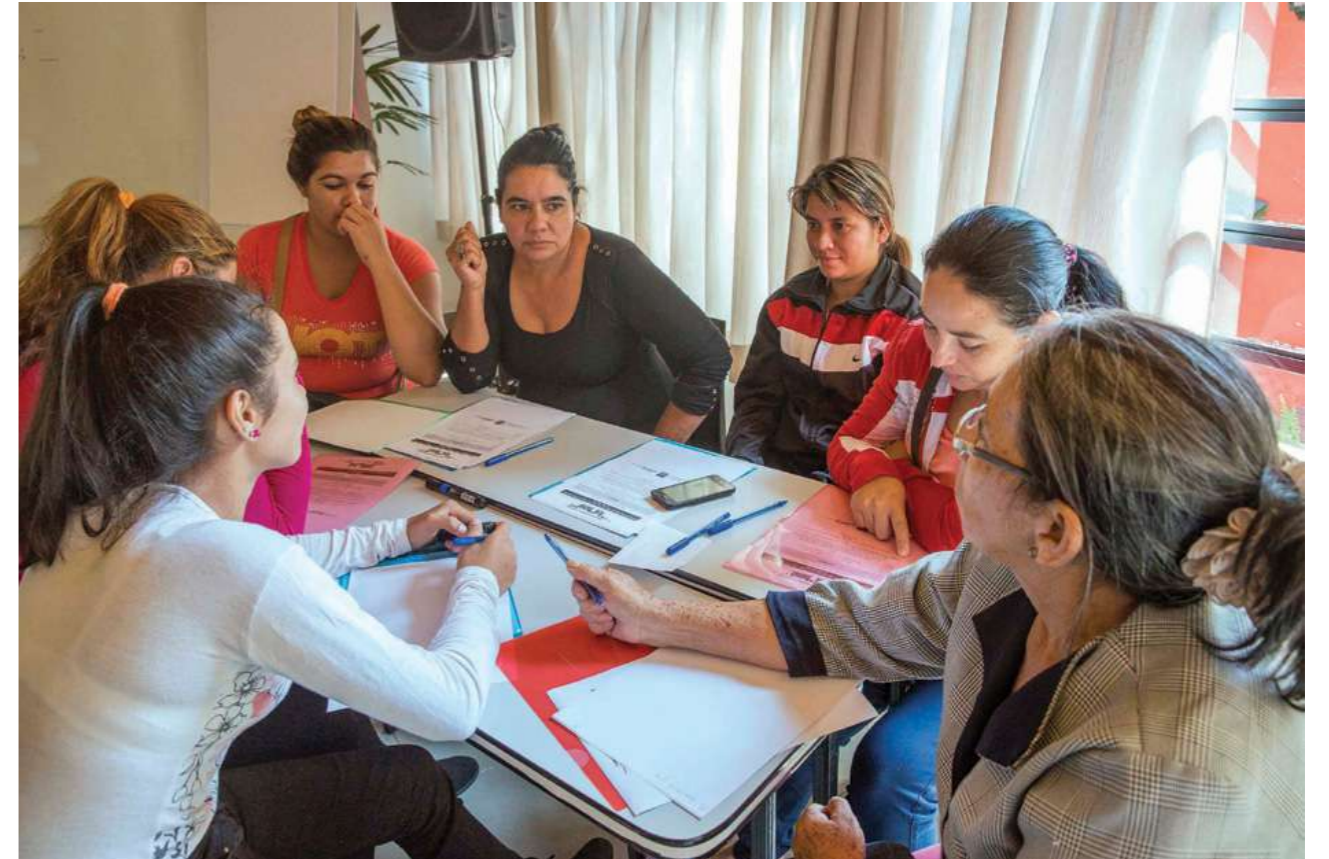
19 de marzo de 2017. Taller de incidencia y organización. Asunción