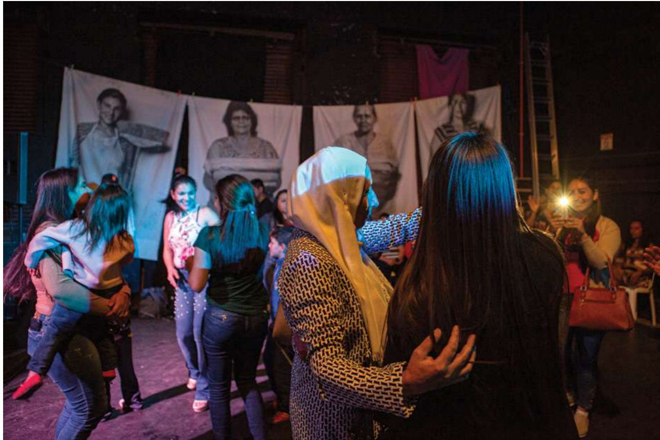
24 y 25 de agosto de 2019. Final del Encuentro Nacional de Trabajadoras Domésticas. La Caósfera. Asunción.