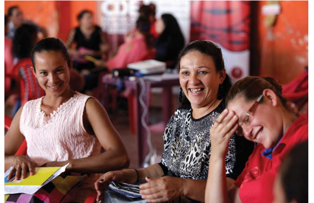
30 de junio de 2019. Encuentro de capacitación con trabajadoras domésticas del Departamento de San Pedro en San Pedro de Ycua Mandiyú.