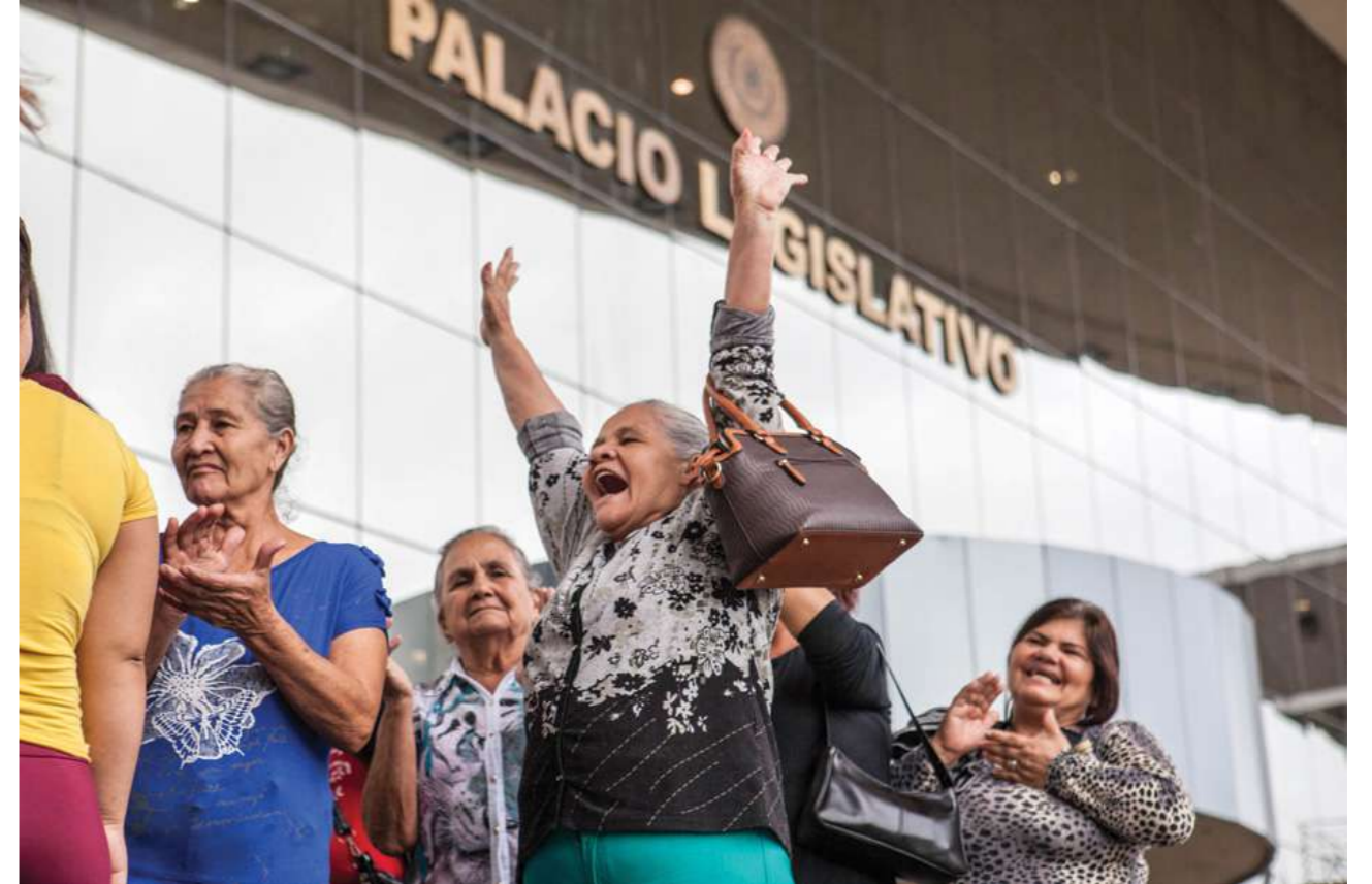
14 de marzo de 2019. La Cámara de Senadores aprueba la modificación del Art. 10 de la Ley 5407, que dispone el 100% del salario mínimo para trabajadoras domésticas.