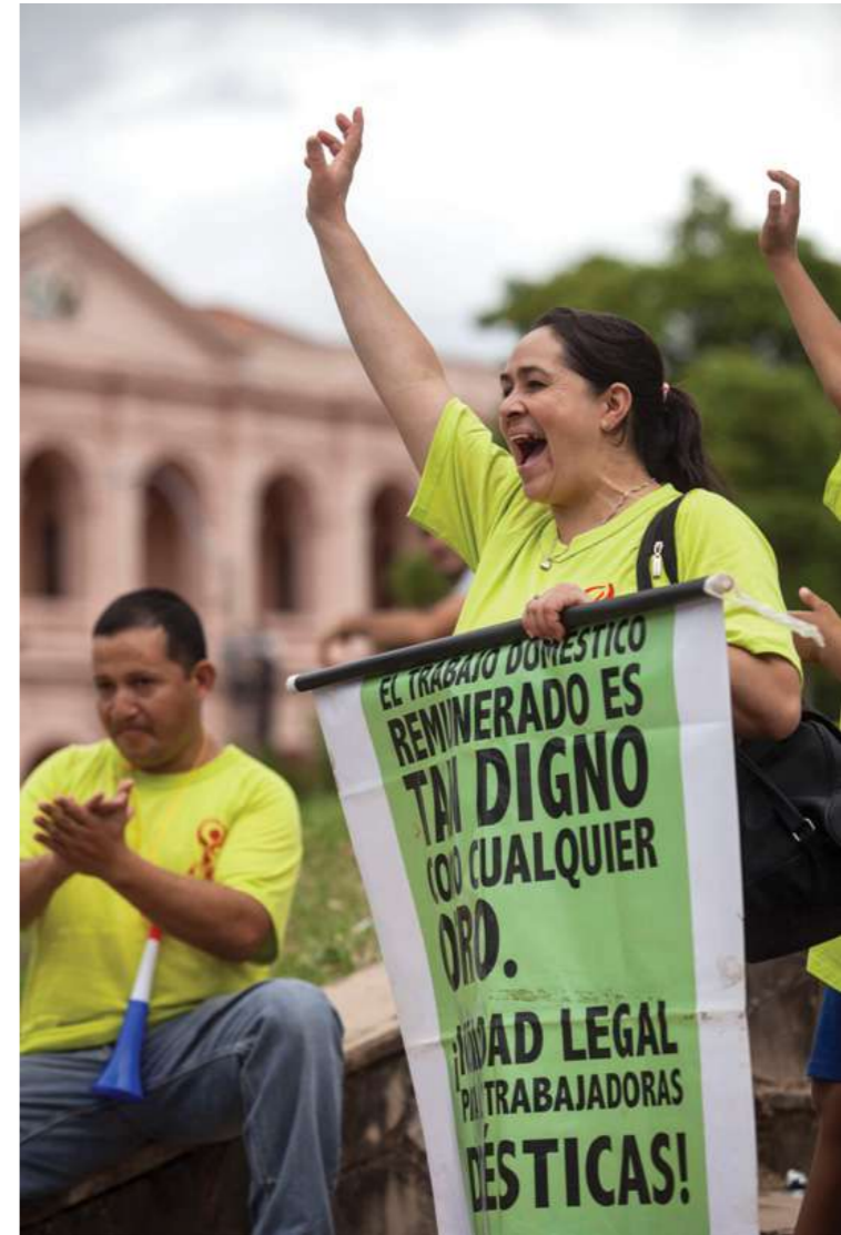
7 de octubre de 2015. Marcha "Igual Valor-Igual Derechos", las trabajadoras domésticas en calles del microcentro de Asunción.