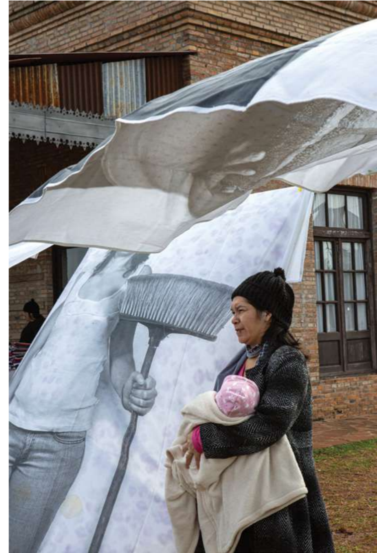
10 de agosto de 2019. Preparación de encuentro de capacitación con trabajadoras domésticas de Itapúa en Encarnación.