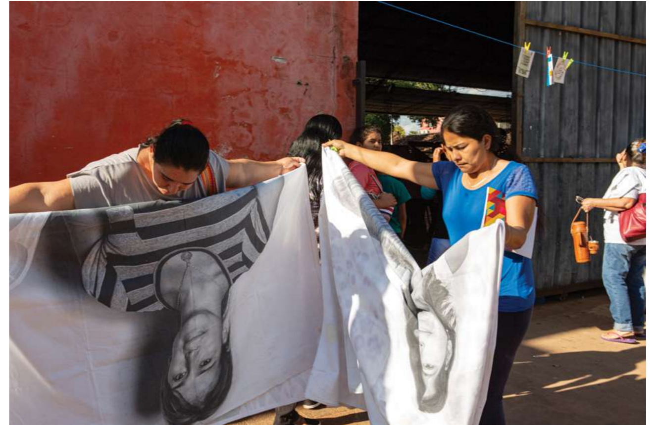
30 de junio de 2019. Encuentro de capacitación con trabajadoras domésticas del Departamento de San Pedro en San Pedro de Ycua Mandiyú.