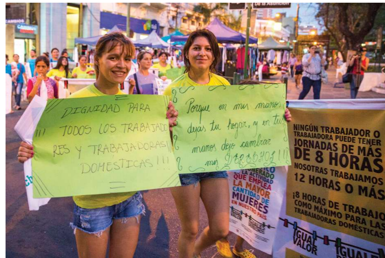
18 de mayo de 2017. Manifestación en la plaza de los Héroes.