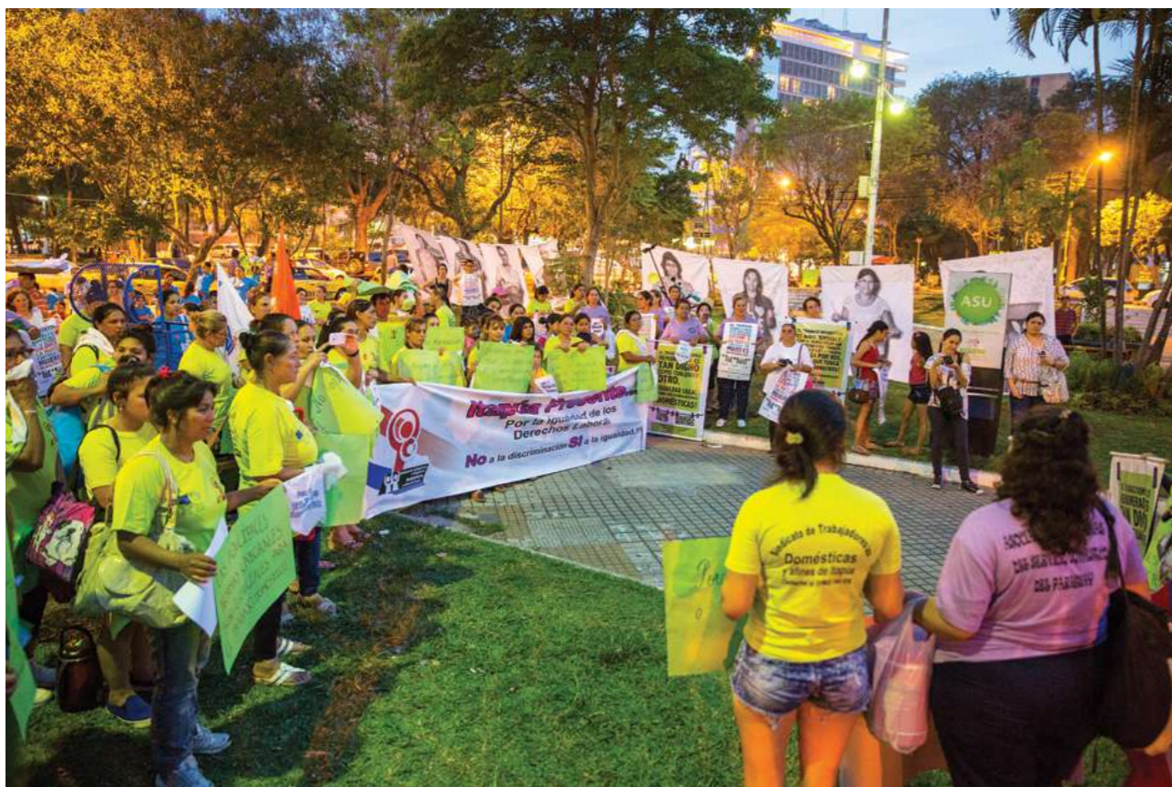
18 de mayo de 2017. Manifestación en la plaza de los Héroes.