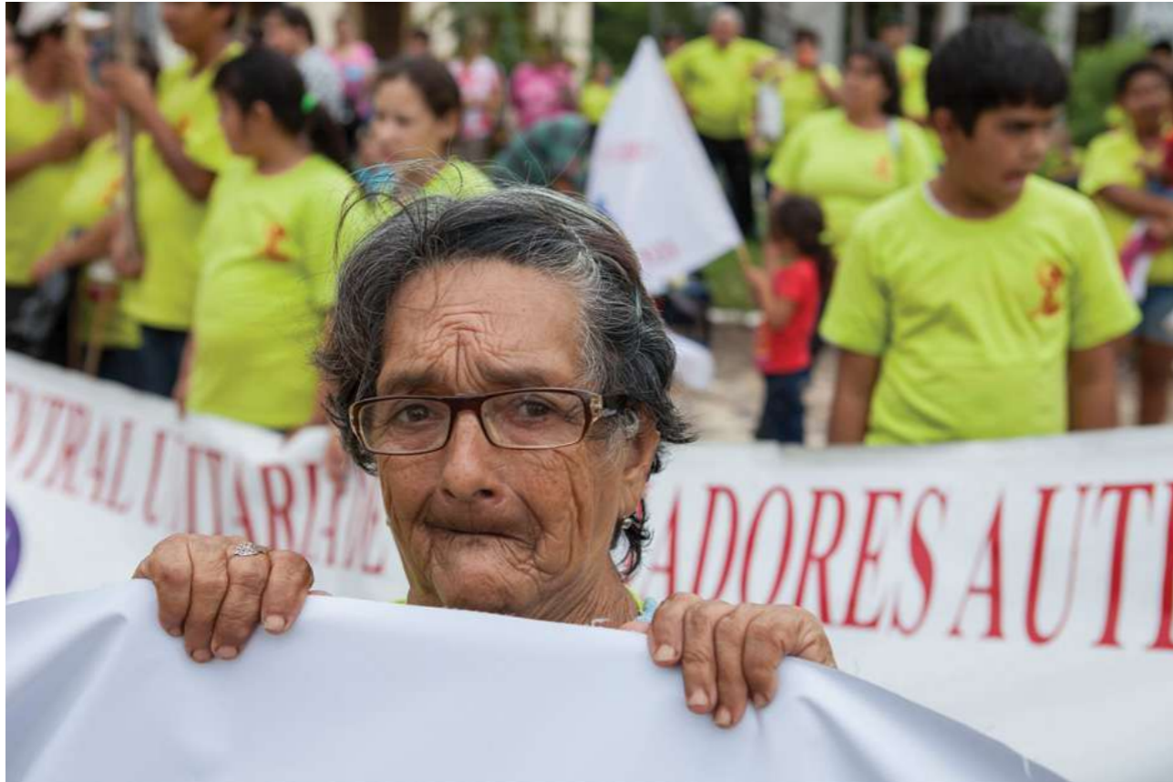
7 de octubre de 2015. Marcha "Igual Valor-Igual Derechos", las trabajadoras domésticas en calles del microcentro de Asunción.