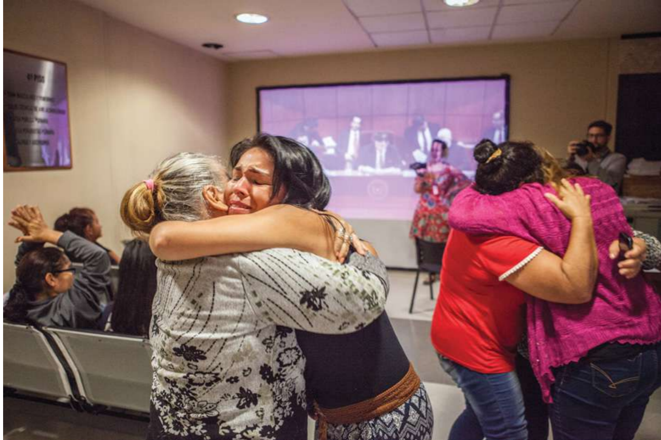
14 de marzo de 2019. La Cámara de Senadores aprueba la modificación del Art. 10 de la Ley 5407, que dispone el 100% del salario mínimo para trabajadoras domésticas.