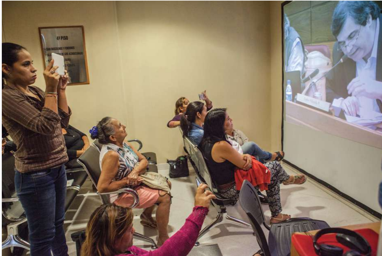
14 de marzo de 2019. La Cámara de Senadores aprueba la modificación del Art. 10 de la Ley 5407, que dispone el 100% del salario mínimo para trabajadoras domésticas.