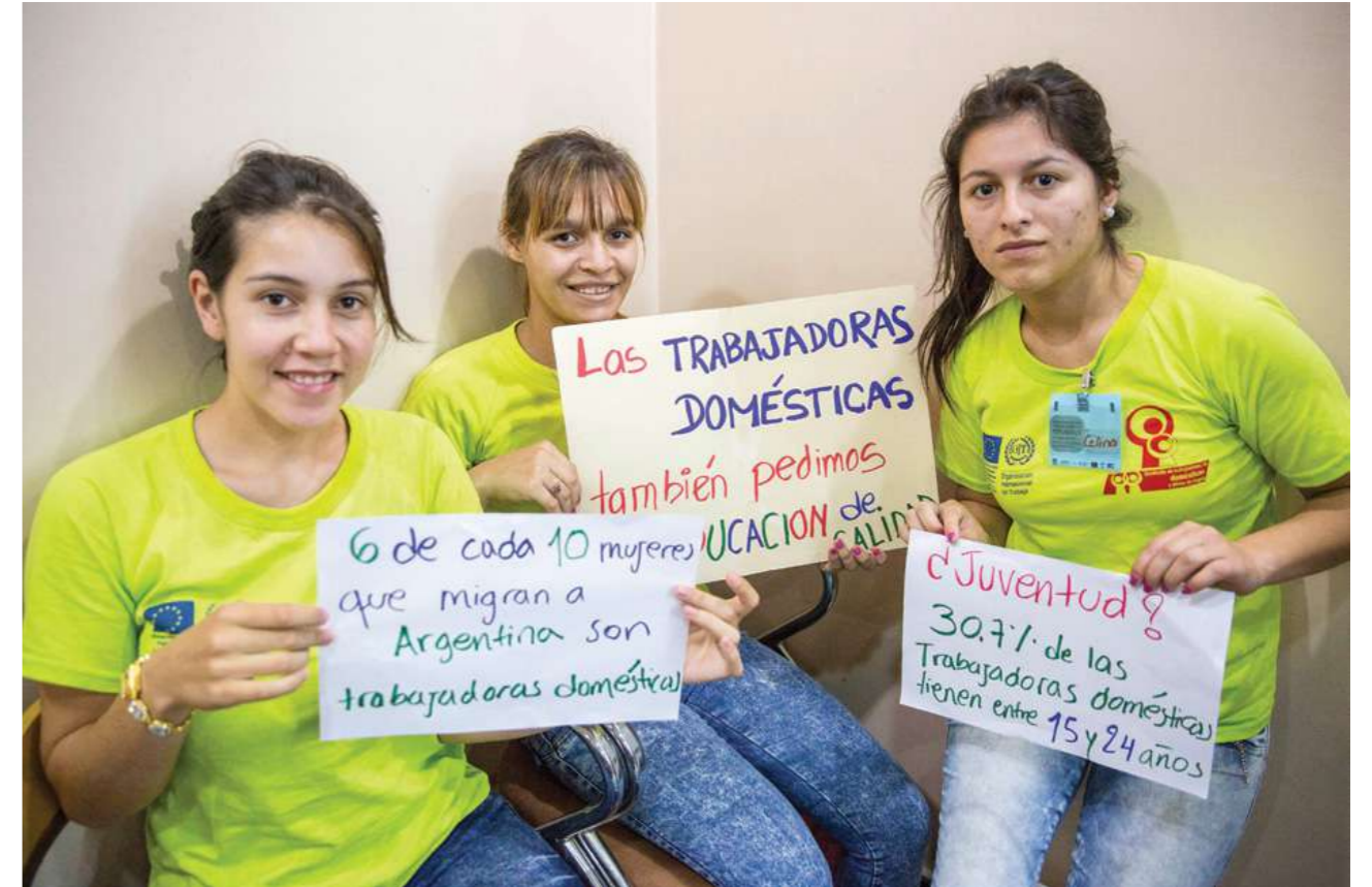
16 de octubre de 2014. Trabajadoras domésticas en la reunión con organizaciones internacionales y de la sociedad civil. Asunción