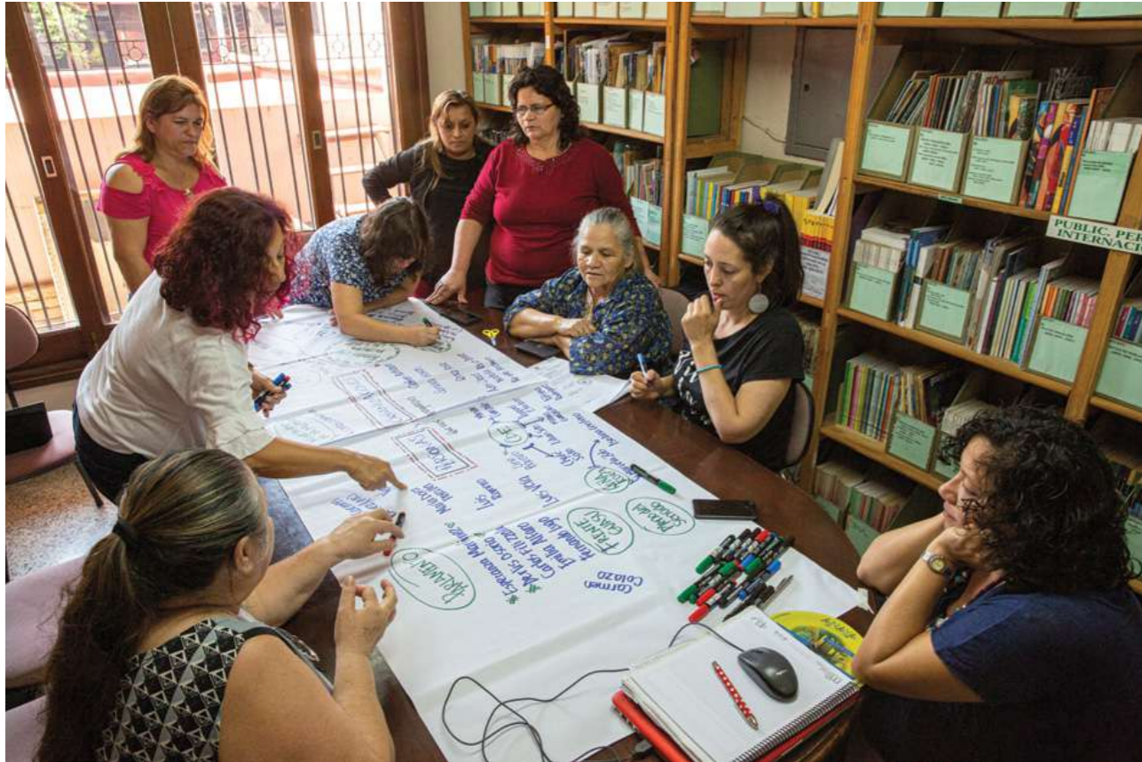
11 de setiembre de 2018. Reunión de planificación de las tareas en la búsqueda del reconocimiento de derechos, en el Centro de Documentación y Estudios - CDE.