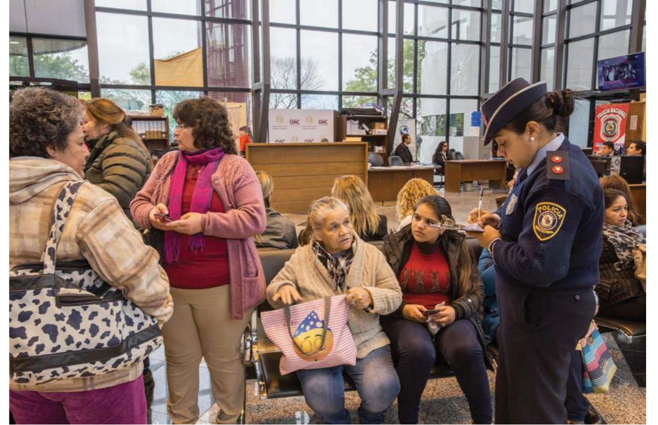
13 de agosto de 2018. Hall del Congreso buscando incidencias.