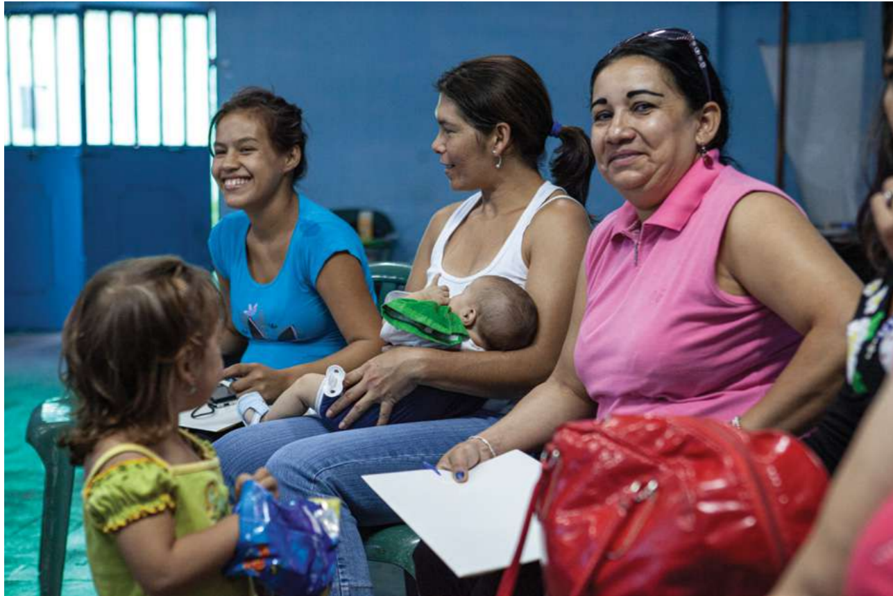
10 de agosto de 2014. Taller de vocería en el local de la Central Nacional de Trabajadores (CNT).