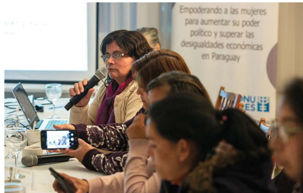
23 de agosto de 2019. Reunión de líderes de las organizaciones de trabajadoras domésticas con la delegación de mujeres de la organización Mother's School Society (MSS) de Palestina, en visita de intercambio y aprendizaje sobre las luchas y estrategias de las mujeres en el Paraguay.