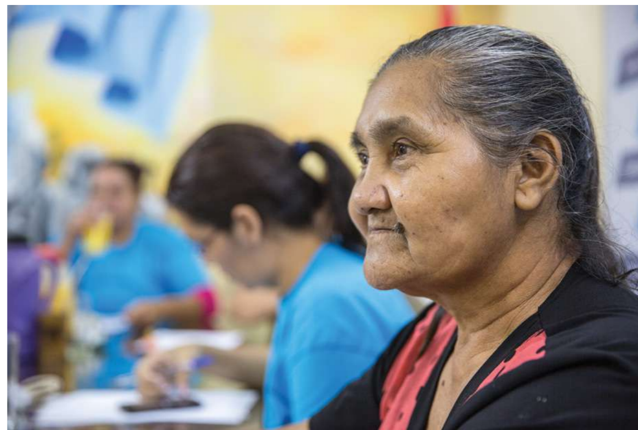
17 de abril de 2016. Taller de fortalecimiento organizacional y liderazgo colectivo del SINTRADOP.