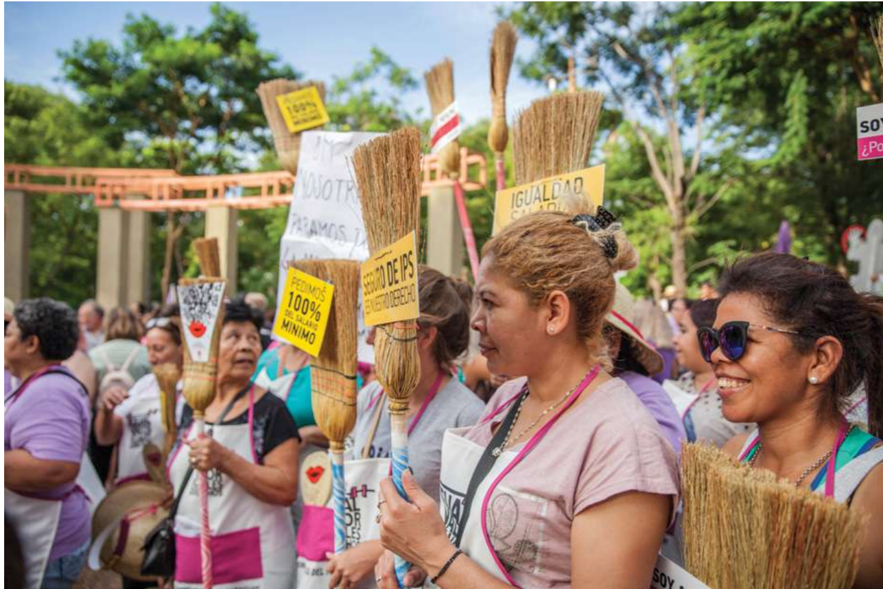
8 de marzo de 2019. Participación en la manifestación del 8M, Plaza Italia, Asunción.