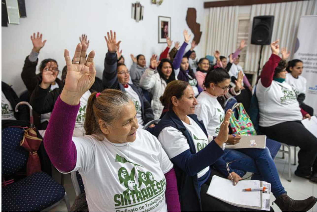
8 de julio de 2018. Asamblea SINTRADESPY, Sindicato de Trabajadoras del Servicio Doméstico del Paraguay.