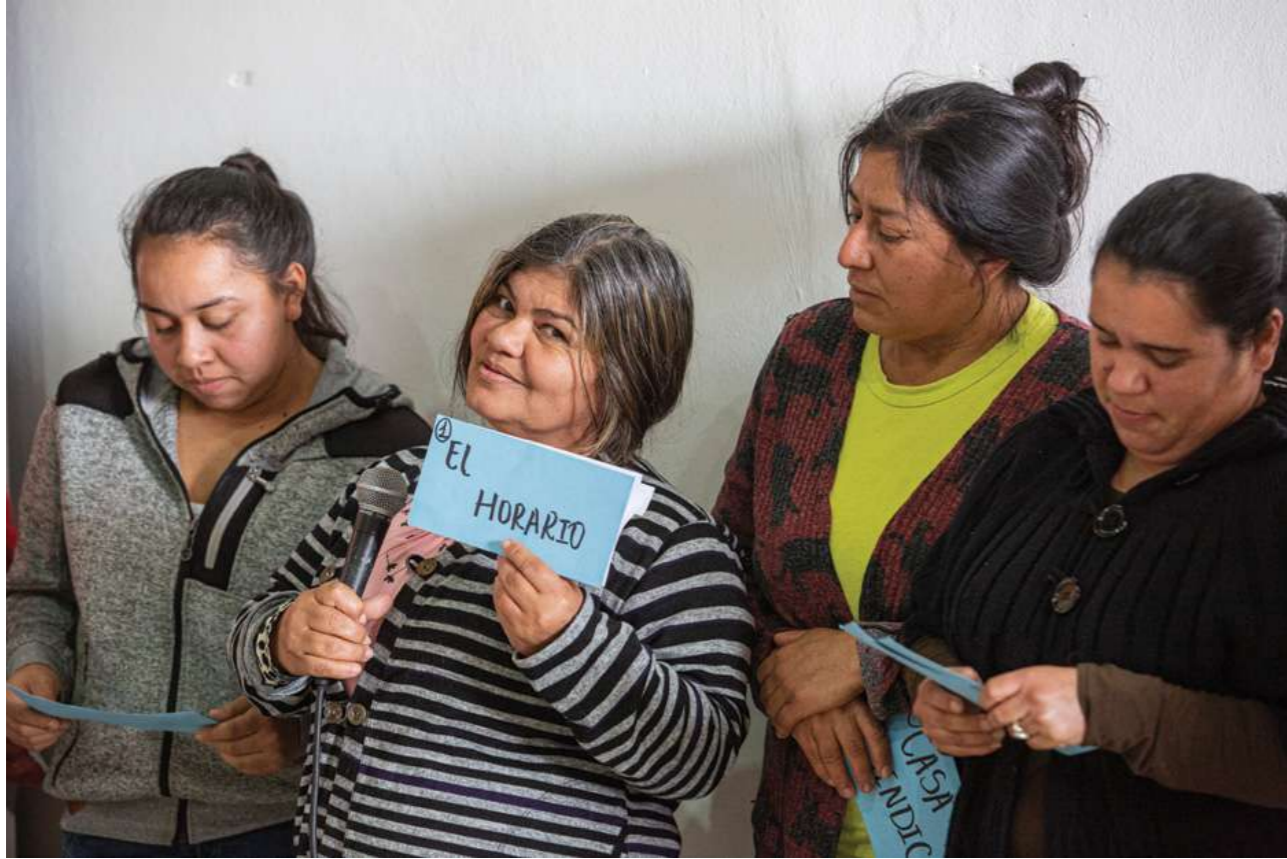
11 de agosto de 2019. Encuentro de capacitación con trabajadoras domésticas de Itapúa en Encarnación.