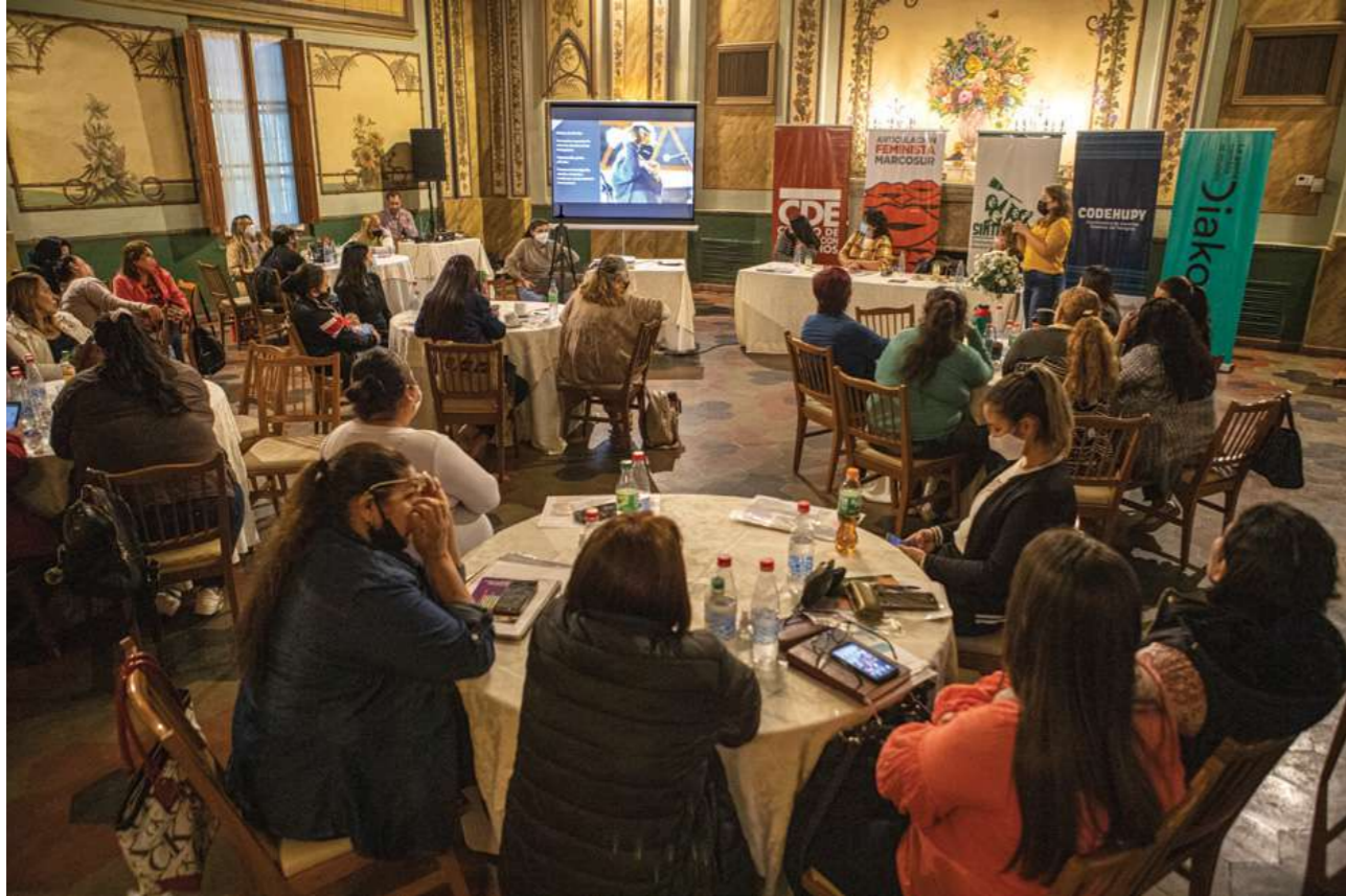
17 de octubre de 2021. Primer encuentro de trabajadoras domésticas después de la crisis de la pandemia del Covid-19.