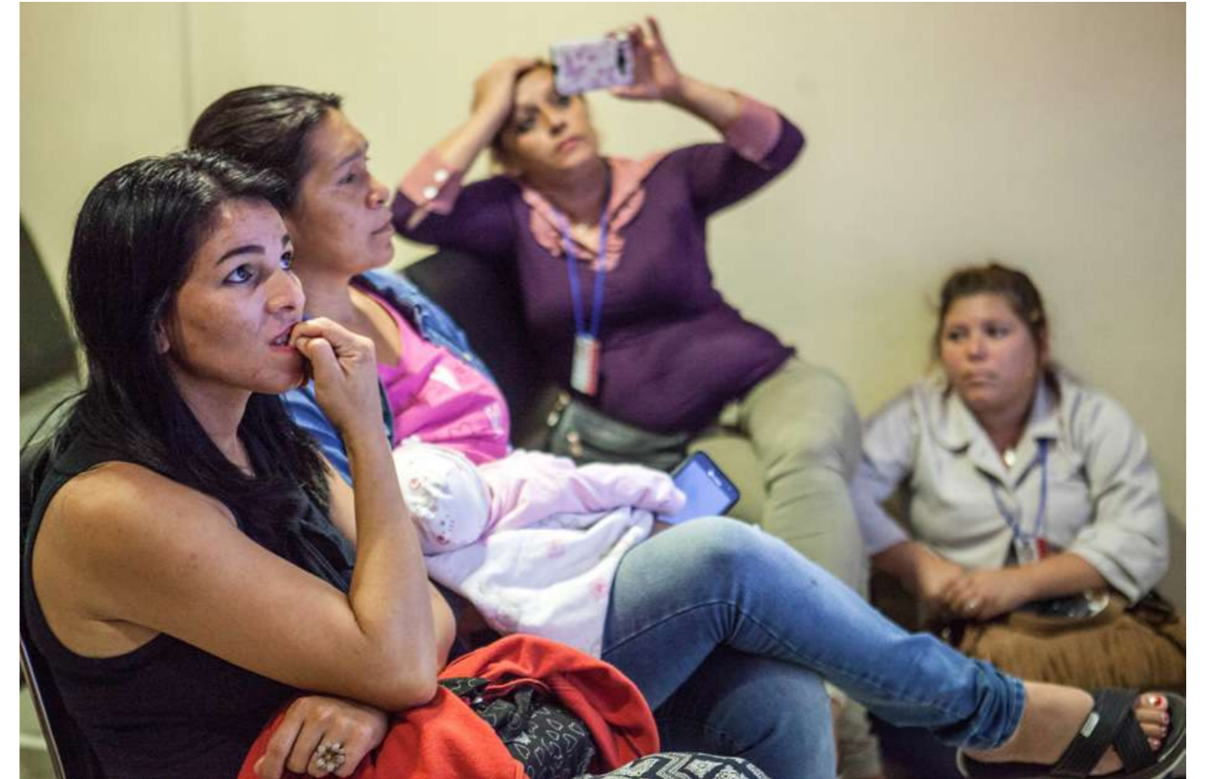
1 y 2 de febrero de 2014. Encuentro de trabajadoras domésticas remuneradas "Compartiendo acciones realizadas y diseñando estrategias futuras". Casa de la Familia Salesiana. Ypacaraí.