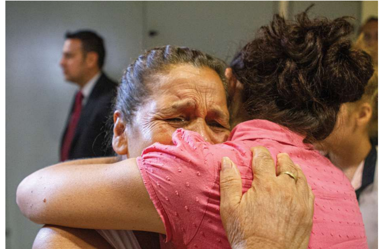
17 de marzo de 2015. La Cámara de Diputados sanciona la Ley del Trabajo Doméstico sin igualdad salarial.