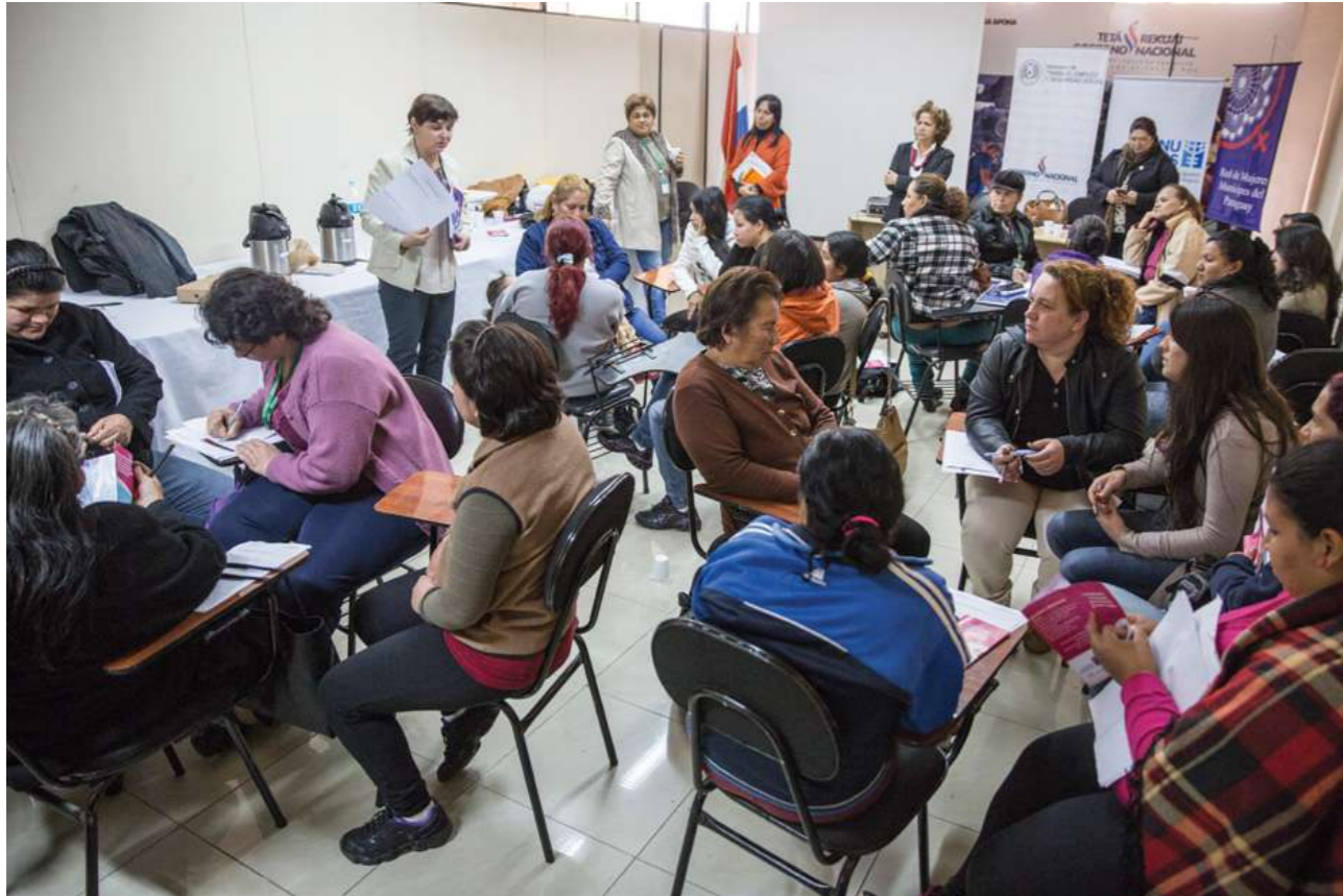
30 de agosto de 2016. Taller de capacitación en el Ministerio del Trabajo, Empleo y Seguridad Social, sobre leyes laborales y contrato de trabajo.