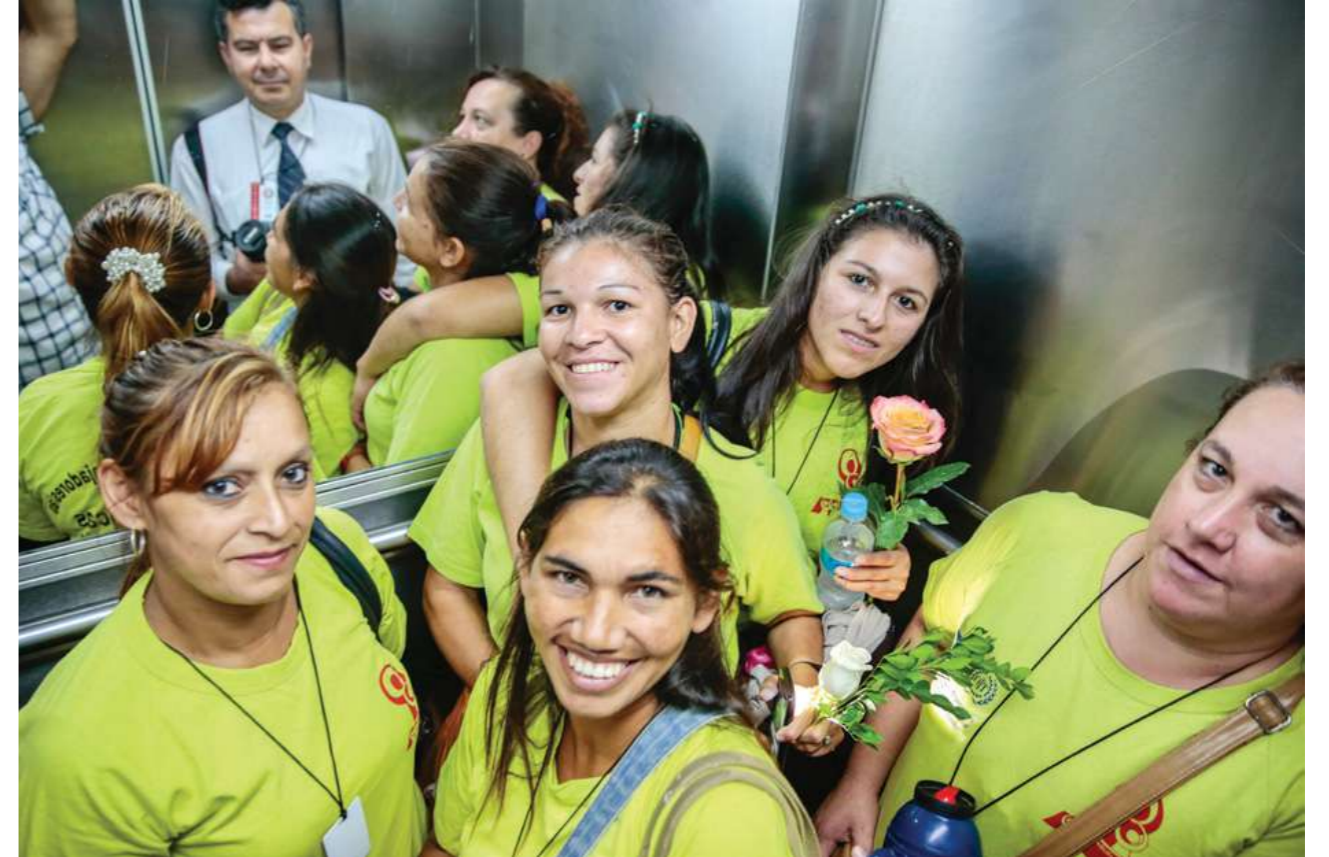
30 de marzo de 2016. Reunión con en la Cámara de Senadores con la Comisión de Legislación, Codificación, Justicia y Trabajo.