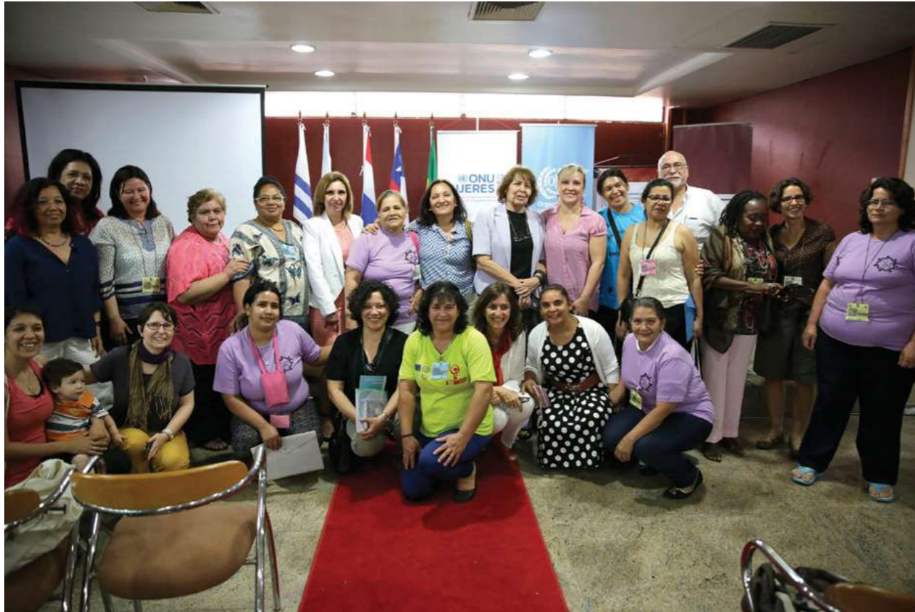
16 de octubre de 2014. Reunión de trabajadoras domésticas con organizaciones internacionales y de la sociedad civil. Asunción