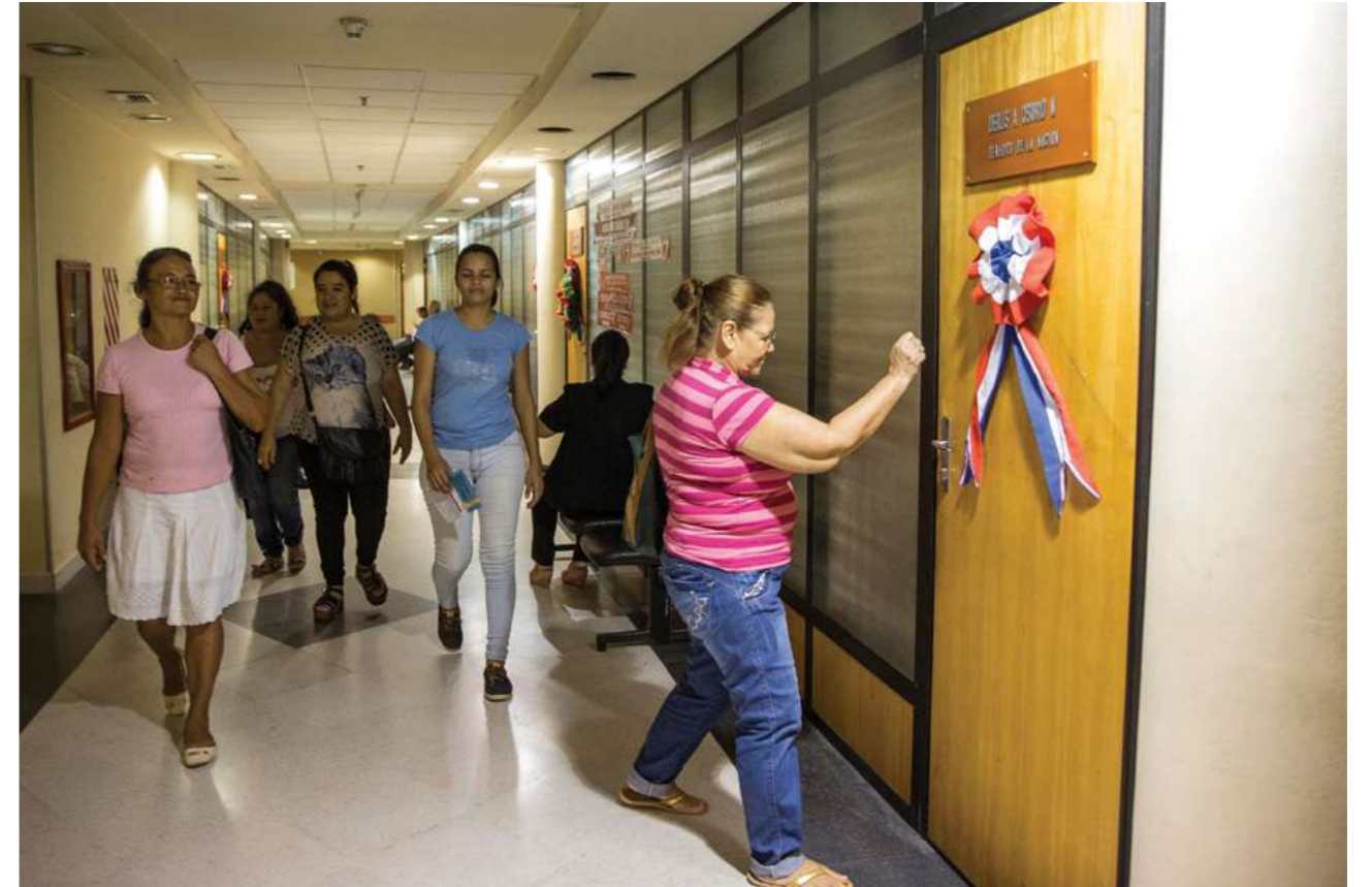
6 de julio de 2018. Lobby en el Senado, oficina del senador Derlis Osorio.