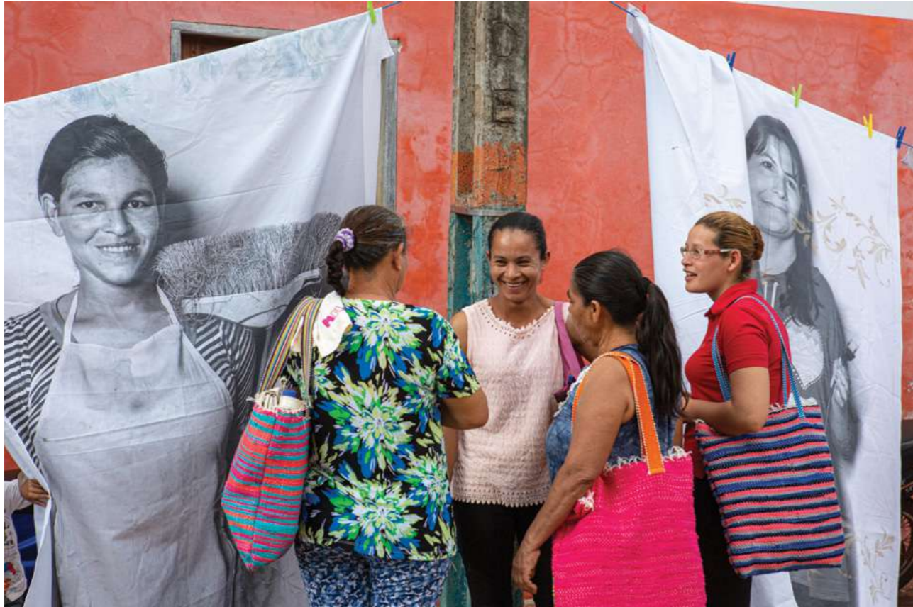
30 de junio de 2019. Encuentro de capacitación con trabajadoras domésticas del Departamento de San Pedro en San Pedro de Ycua Mandiyú.