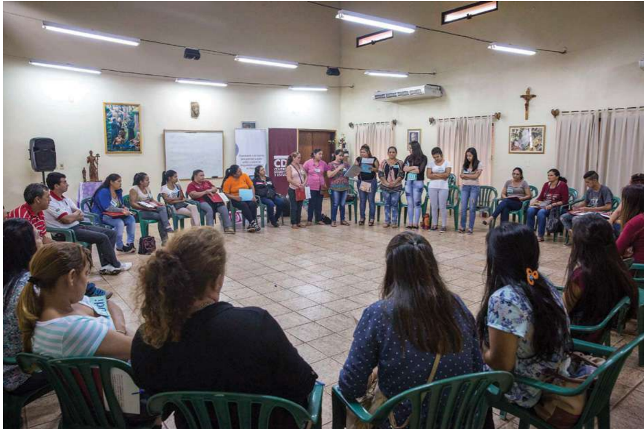
26 de marzo de 2017. Taller de Incidencia en Encarnación.