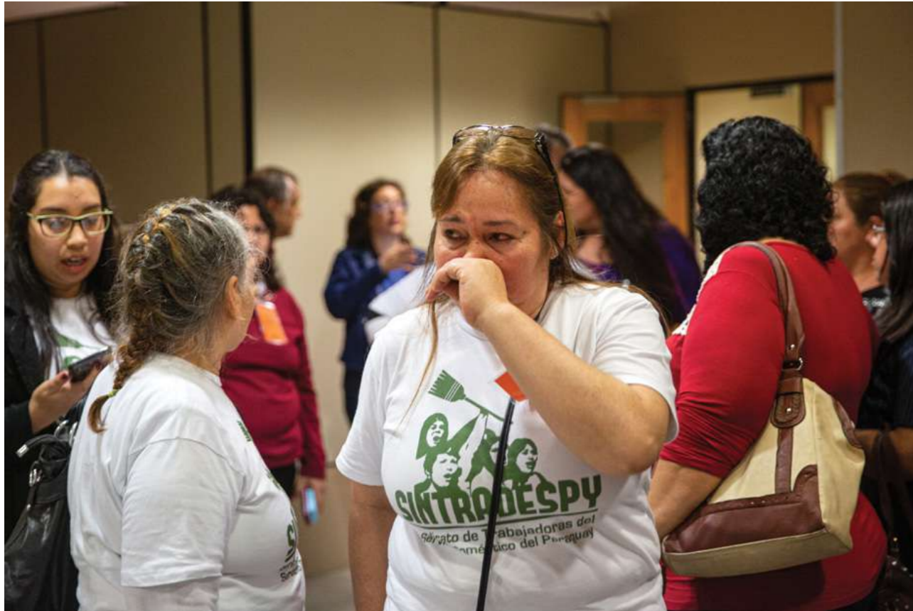
26 de setiembre 2018. La Cámara de Diputados se ratifica en 70% del salario mínimo para las trabajadoras domésticas.