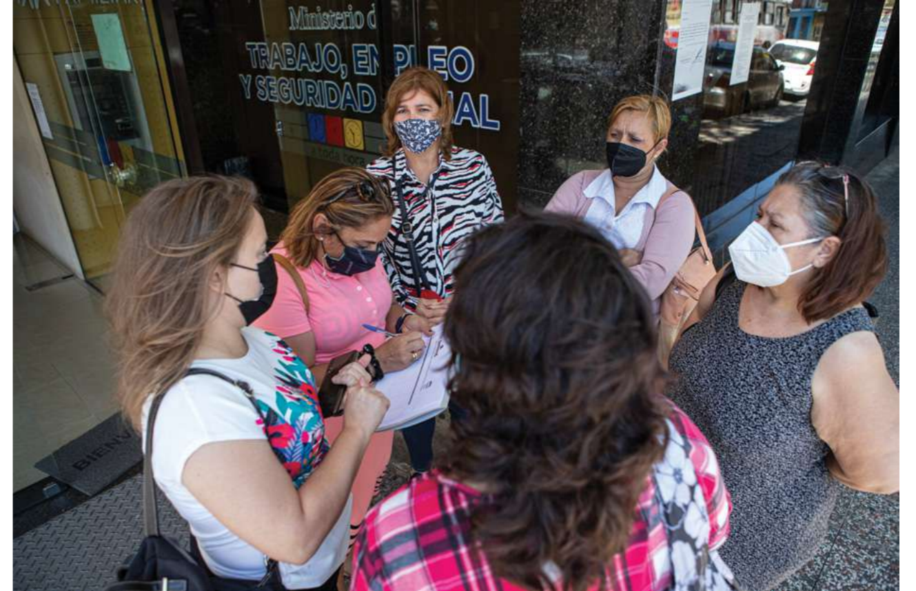
19 de octubre de 2021. Reunión en el Ministerio del Trabajo, Empleo y Seguridad Social para buscar la implementación de la Ley N° 5407 / Del Trabajo Doméstico y sus reglamentaciones.