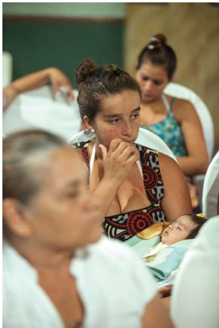
7 de mayo de 2014. Seminario de debates sobre los estándares de la OIT para el trabajo doméstico.