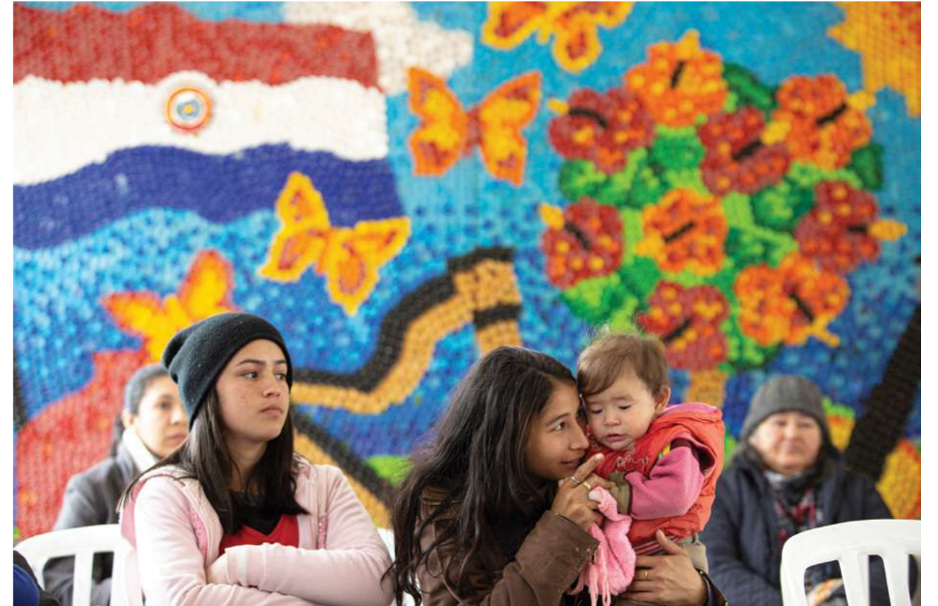
7 de julio de 2019. Encuentro de capacitación con trabajadoras domésticas de Guairá en Villarrica.