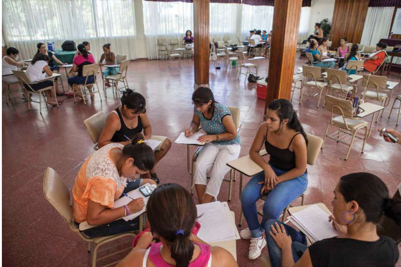
1 y 2 de febrero de 2014. Encuentro de trabajadoras domésticas remuneradas "Compartiendo acciones realizadas y diseñando estrategias futuras". Casa de la Familia Salesiana. Ypacaraí.