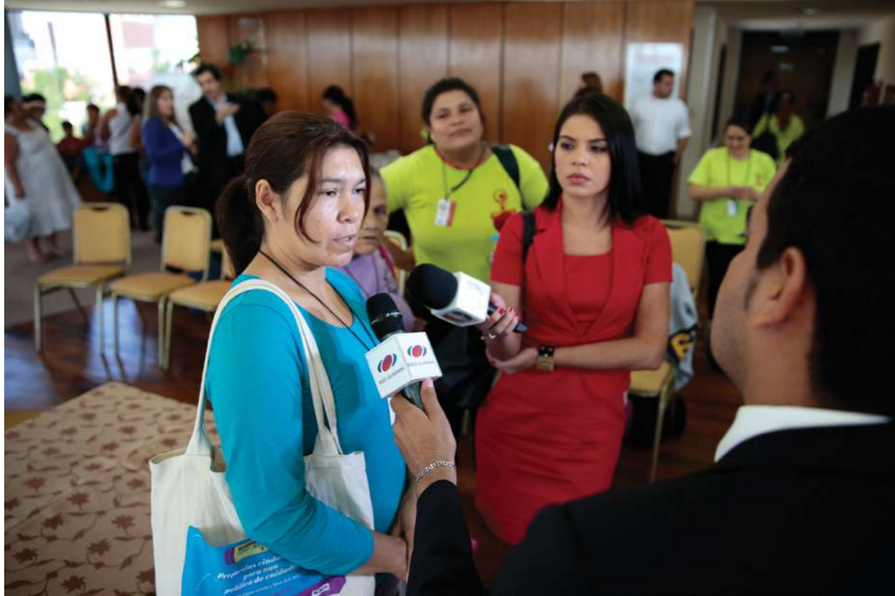
30 de marzo de 2016. Reunión en la Cámara de Senadores con la Comisión de Legislación, Codificación, Justicia y Trabajo