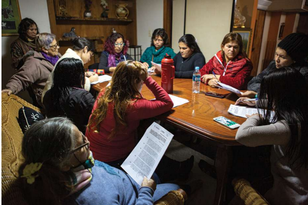
10 de agosto de 2019. Preparación de encuentro de capacitación con trabajadoras domésticas de Itapúa en Encarnación.