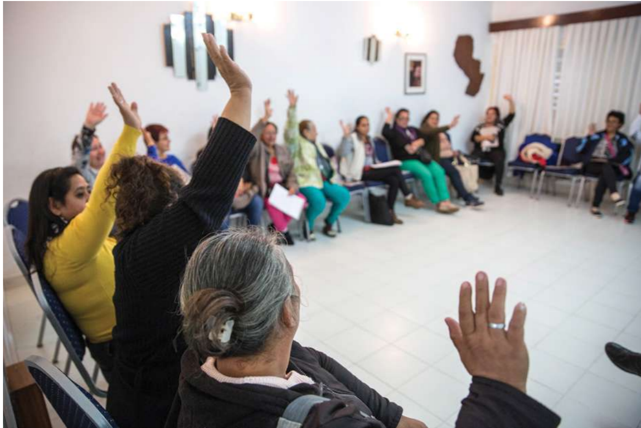
12 de marzo de 2017. Reunión y taller de formación de las trabajadoras domésticas.