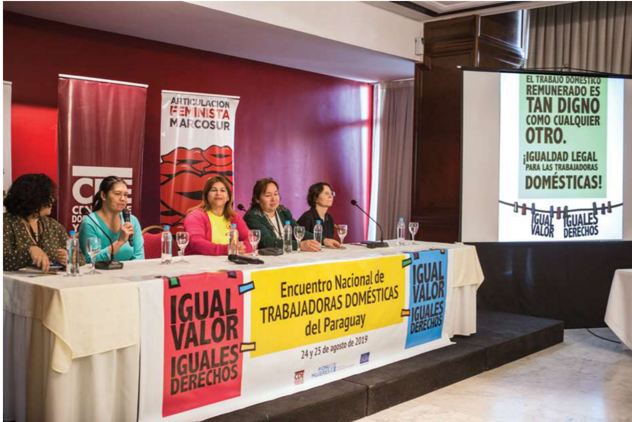
24 y 25 de agosto de 2019. Encuentro Nacional de Trabajadoras Domésticas. Hotel Guarani. Asunción.