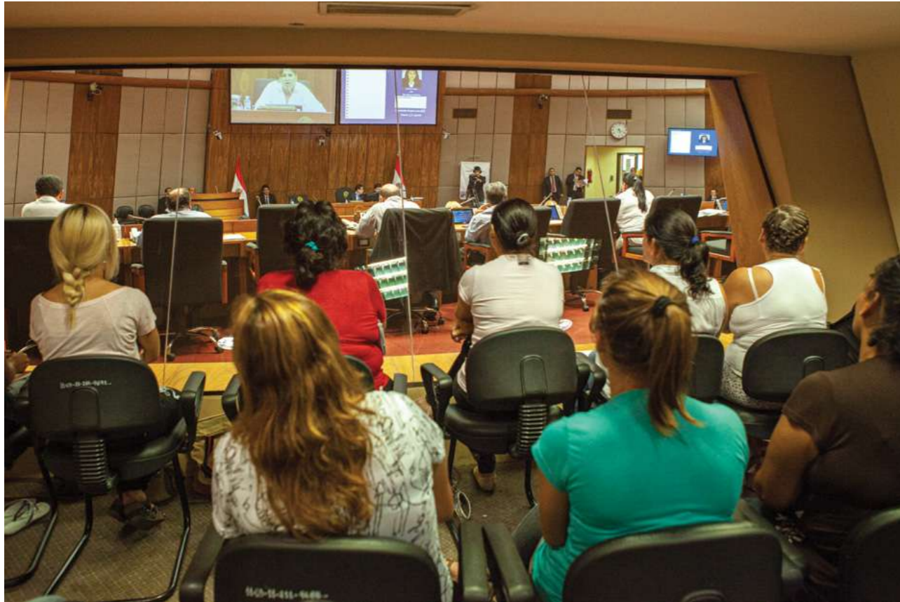
17 de marzo de 2015. Sesión en la Cámara de Diputados que sanciona la Ley sin igualdad salarial.