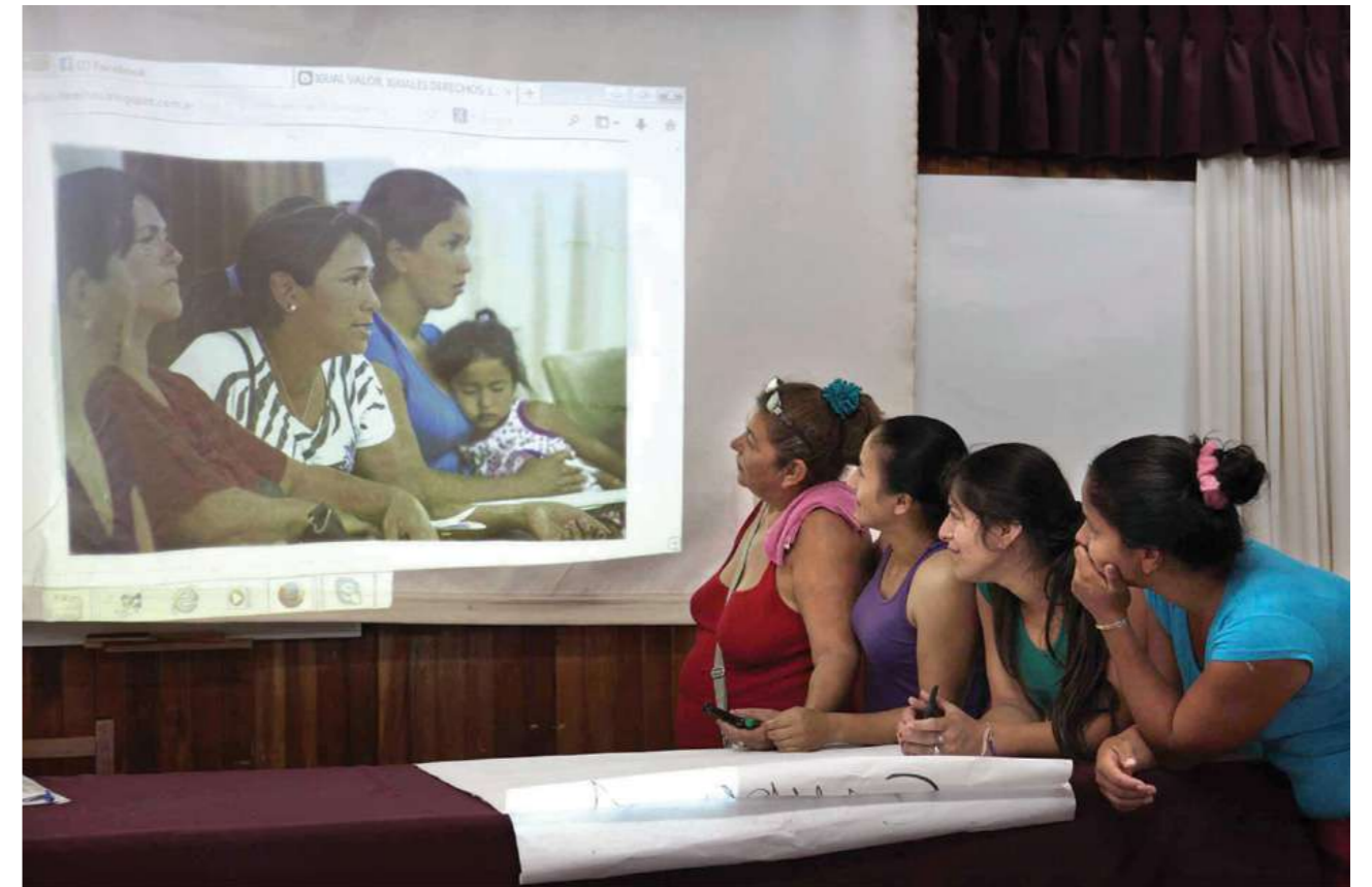
1 y 2 de febrero de 2014. Encuentro de trabajadoras domésticas remuneradas "Compartiendo acciones realizadas y diseñando estrategias futuras". Casa de la Familia Salesiana. Ypacaraí.