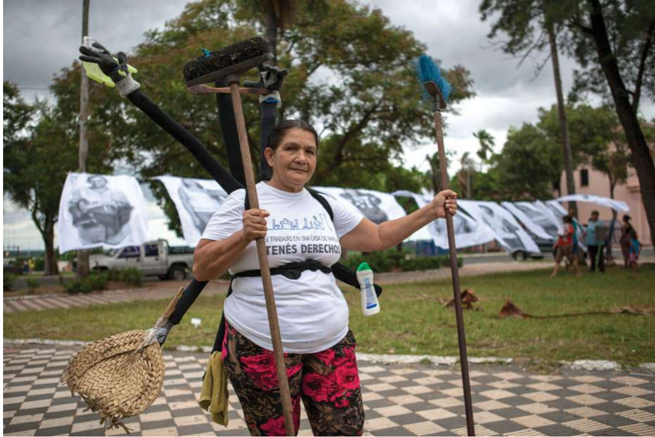
7 de octubre de 2015. Marcha "Igual Valor-Igual Derechos", las trabajadoras domésticas en calles del microcentro de Asunción.