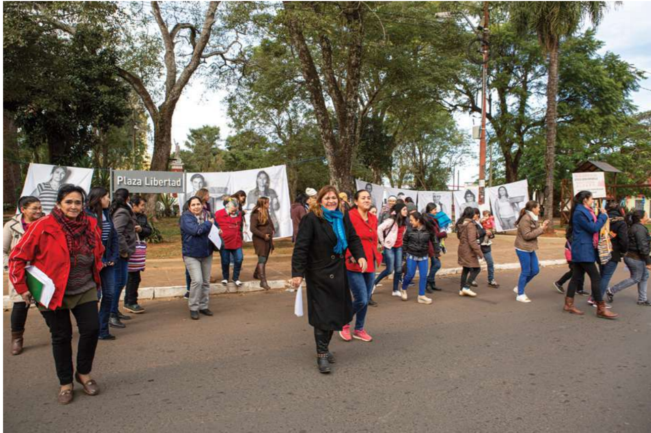
7 de julio de 2019. Encuentro de capacitación con trabajadoras domésticas de Guairá en Villarrica.