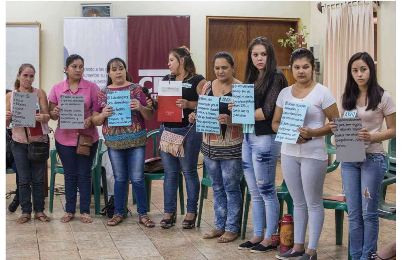
26 de marzo de 2017. Taller de Incidencia en Encarnación.