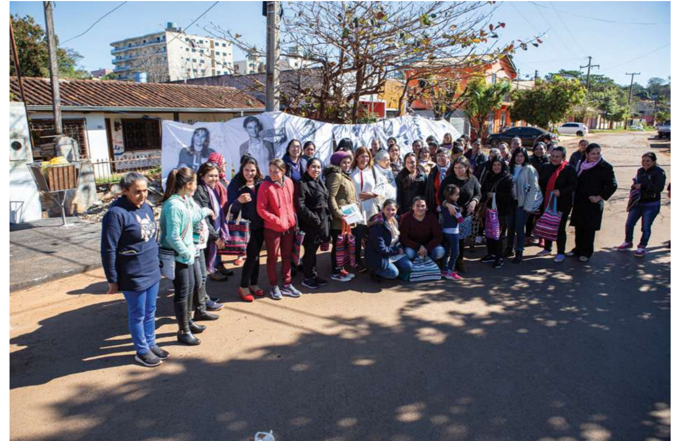
4 de agosto de 2019. Encuentro de capacitación con trabajadoras domésticas de Alto Paraná en Ciudad del Este.