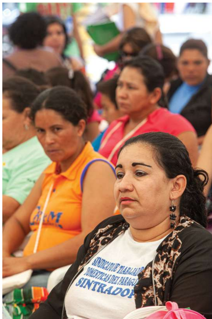
18 de marzo de 2016. Participación en el Encuentro Feminista en la Plaza de la Democracia.