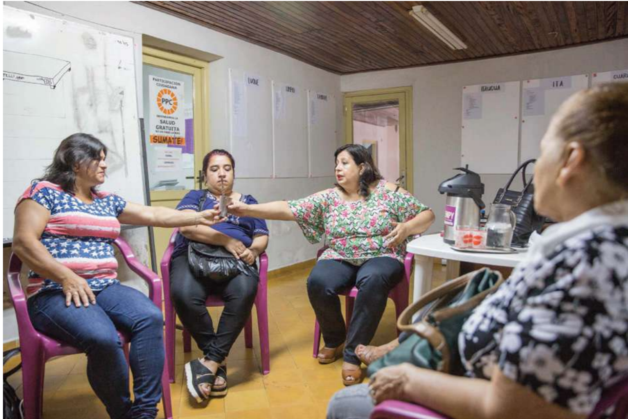
1 de marzo de 2018. Reunión con la senadora Esperanza Martínez, en el local del Partido de la Participación Ciudadana.