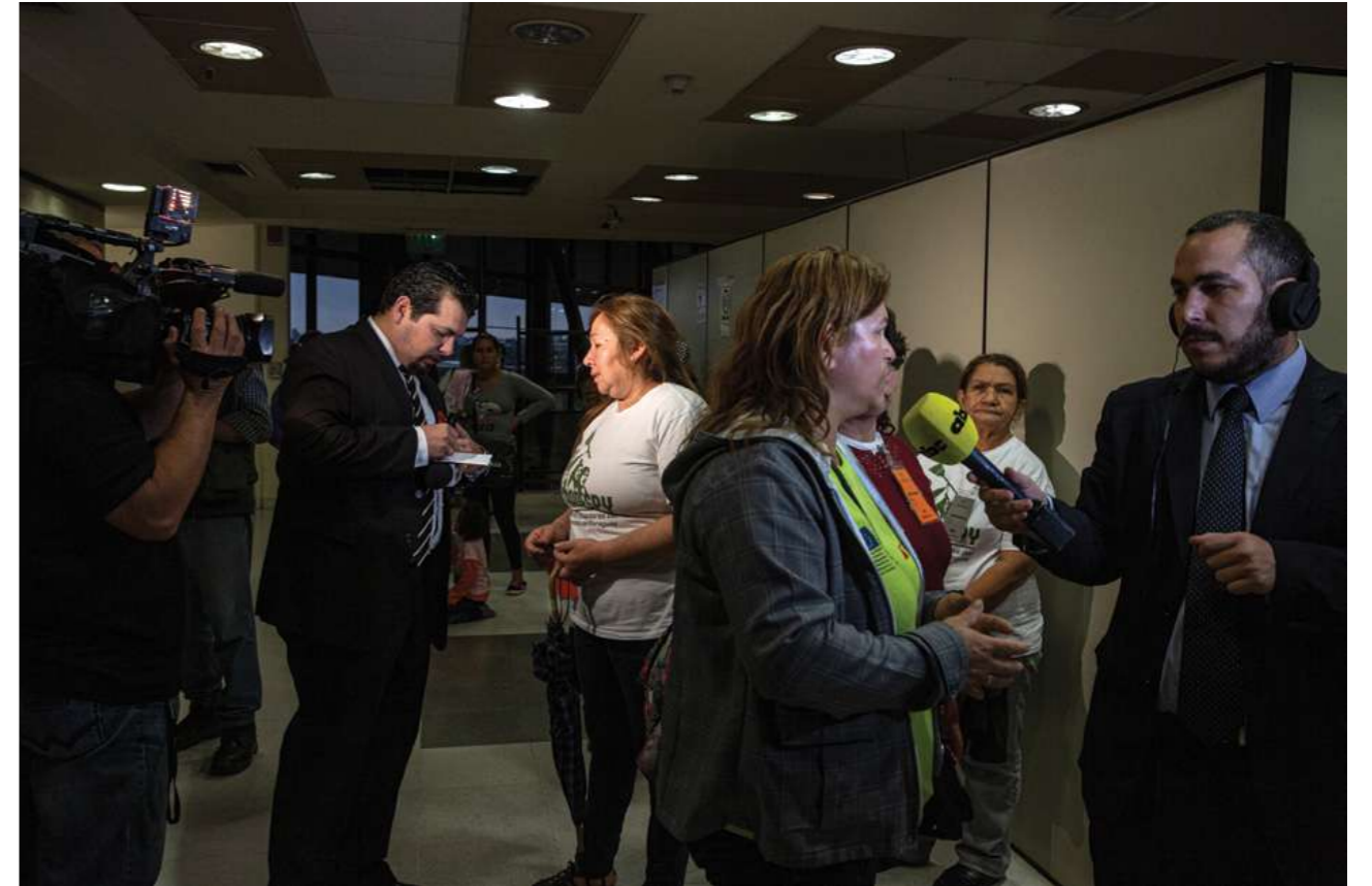
26 de setiembre 2018. La Cámara de Diputados se ratifica en 70% del salario mínimo para las trabajadoras domésticas.