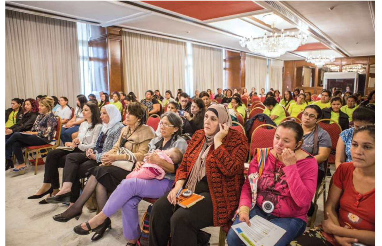
24 y 25 de agosto de 2019. Encuentro Nacional de Trabajadoras Domésticas. Hotel Guarani. Asunción.