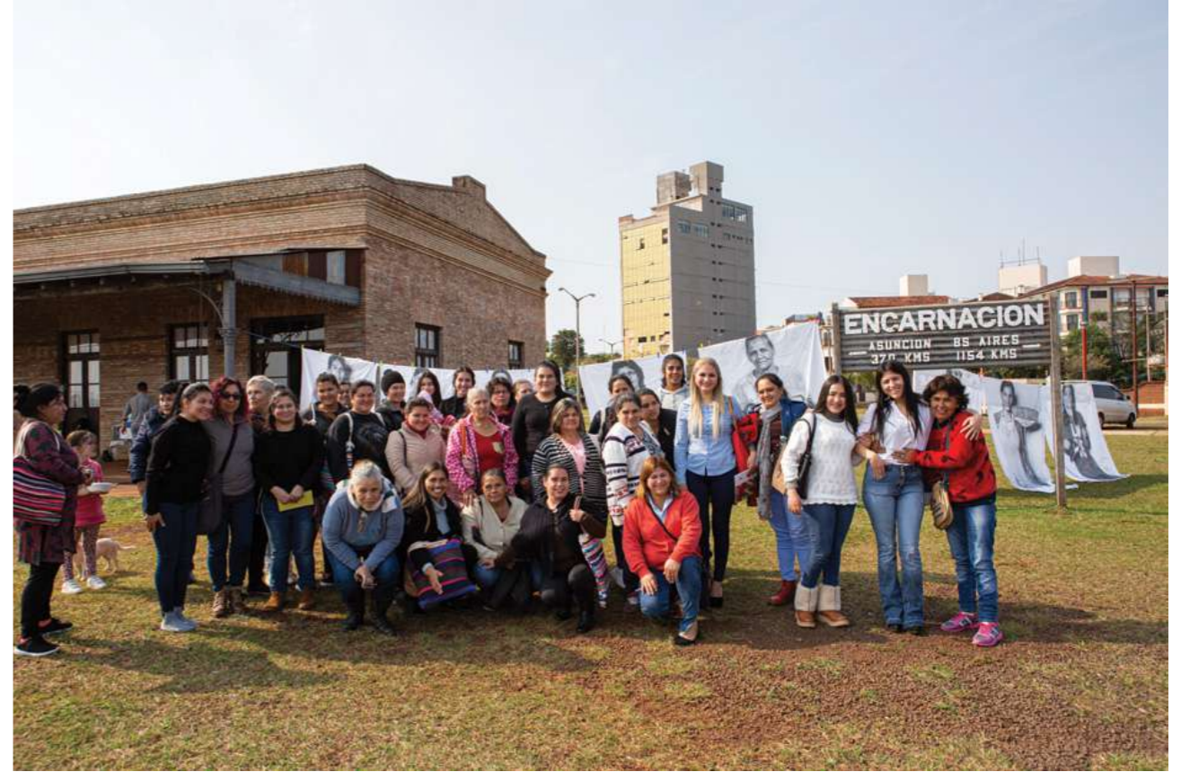
11 de agosto de 2019. Encuentro de capacitación con trabajadoras domésticas de Itapúa en Encarnación.