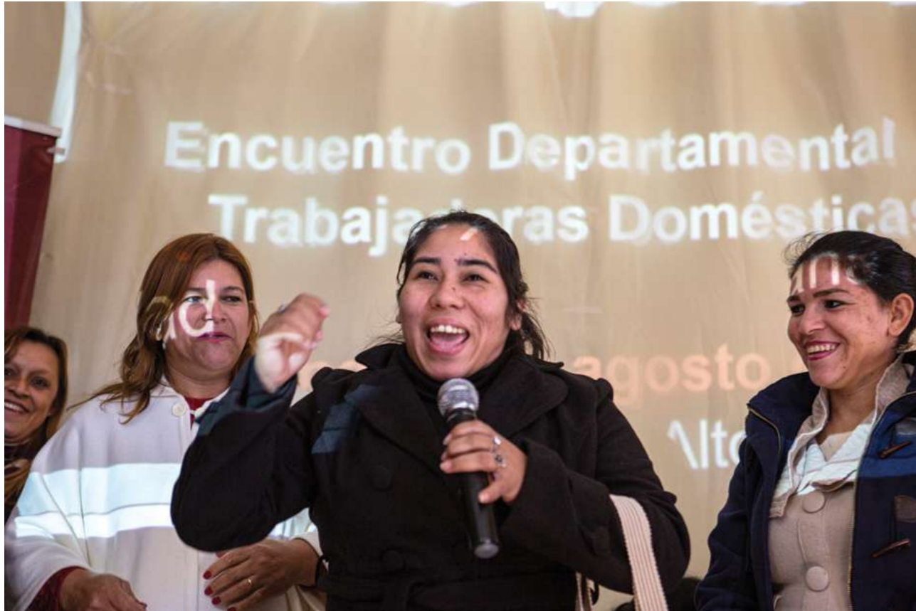
4 de agosto de 2019. Encuentro de capacitación con trabajadoras domésticas de Alto Paraná en Ciudad del Este.