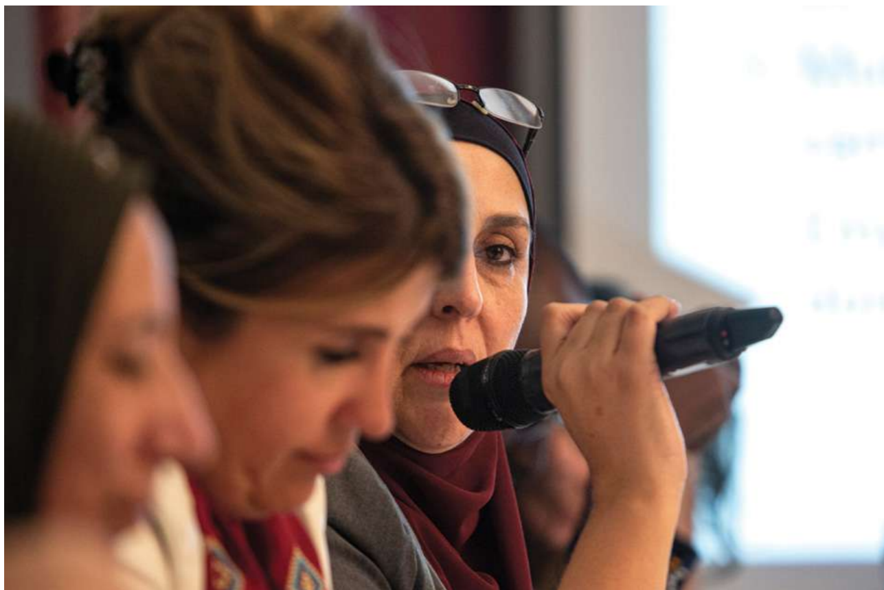
23 de agosto de 2019. Reunión de líderes de las organizaciones de trabajadoras domésticas con la delegación de mujeres de la organización Mother's School Society (MSS) de Palestina, en visita de intercambio y aprendizaje sobre las luchas y estrategias de las mujeres en el Paraguay.