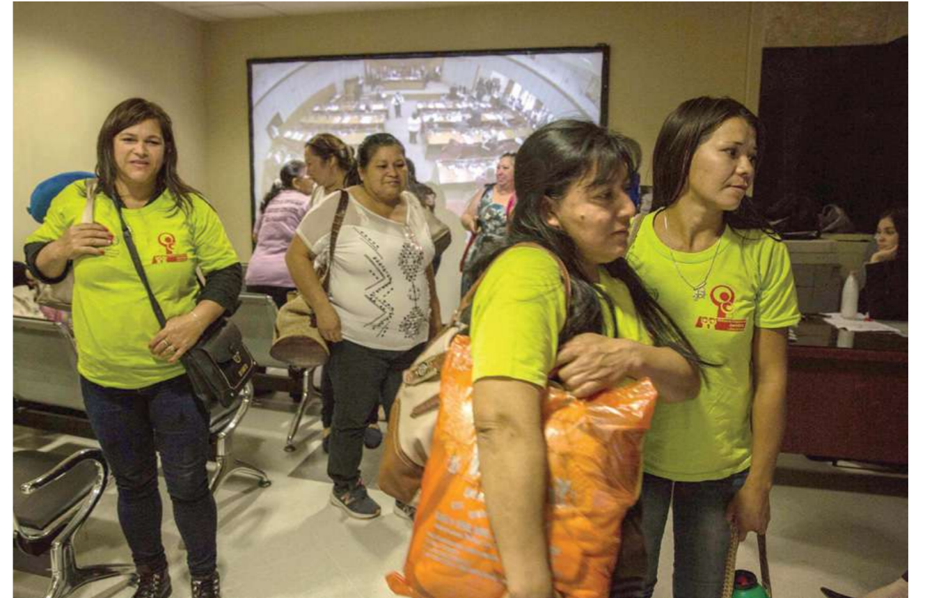
12 de junio de 2014. Sesión de la Cámara de Senadores. Tratamiento de la Ley, postergado.