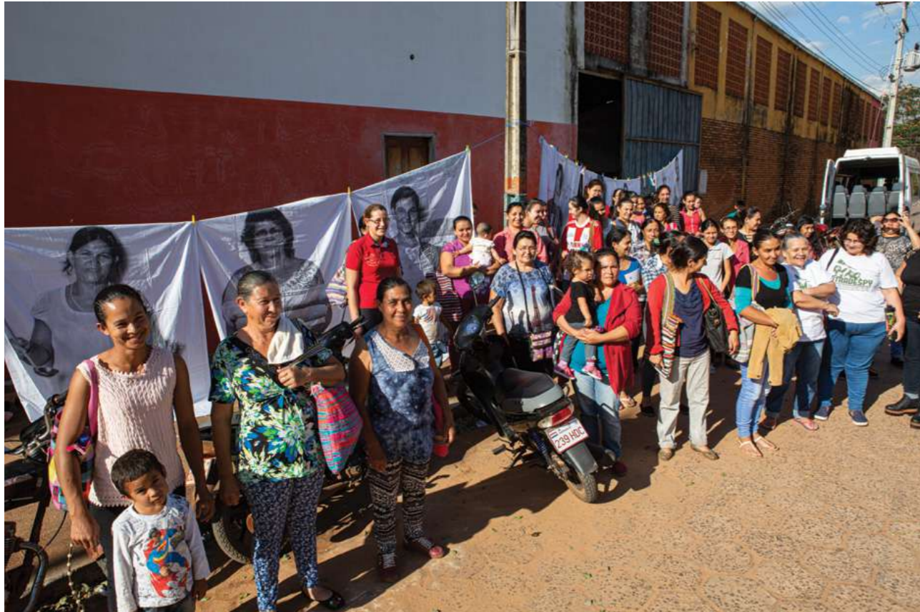
30 de junio de 2019. Encuentro de capacitación con trabajadoras domésticas del Departamento de San Pedro en San Pedro de Ycua Mandiyú.