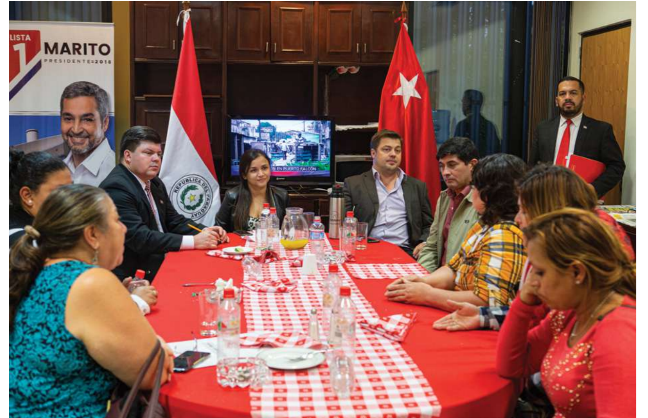
18 de mayo de 2019. Reunión en la Bancada ANR de la Cámara de Diputados.