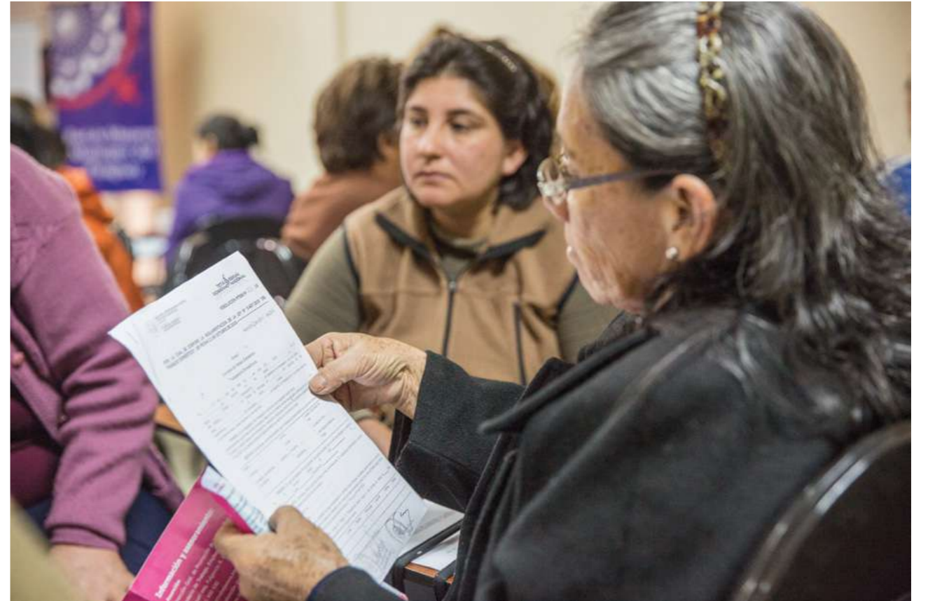
30 de agosto de 2016. Taller de capacitación en el Ministerio del Trabajo, Empleo y Seguridad Social, sobre leyes laborales y contrato de trabajo.