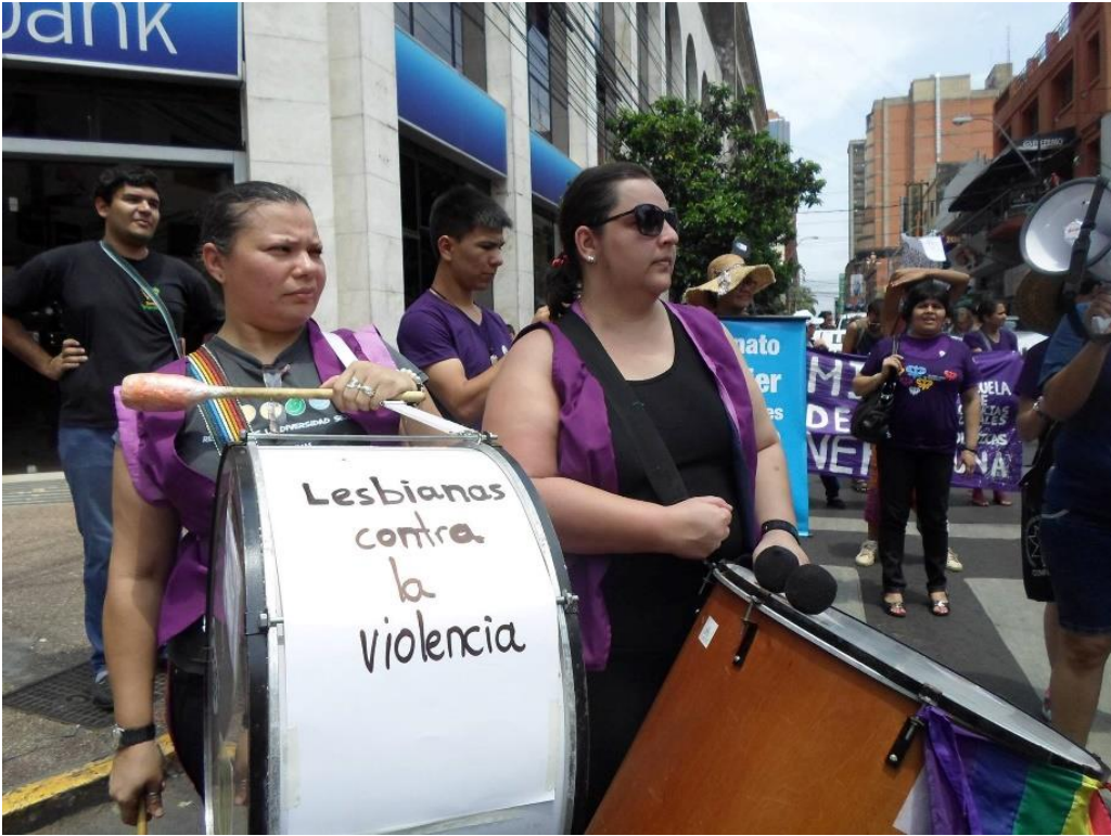
Aireana, Grupo por los Derechos de las Lesbianas